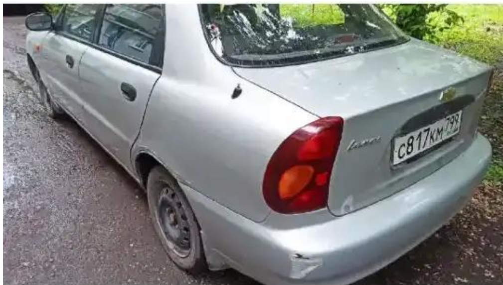
Фото №3. Общий вид ТС