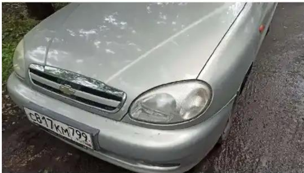
Фото №1. Общий вид ТС