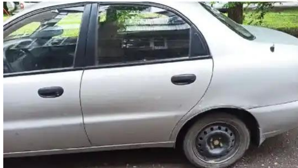
Фото №2. Общий вид ТС