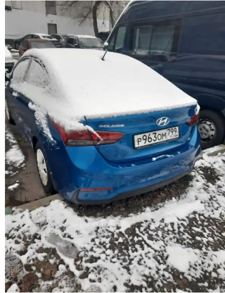
Фото №2. Общий вид