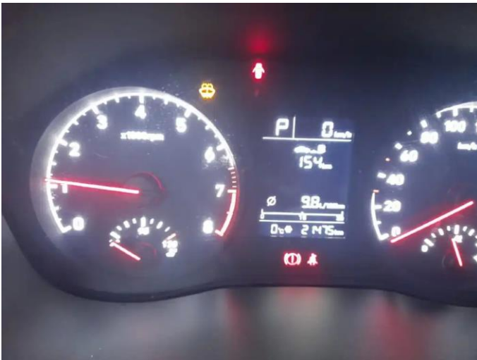
Фото №3. Показания одометра