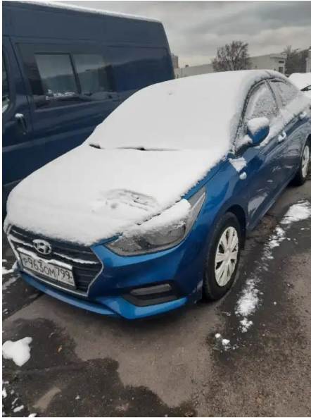
Фото №1. Общий вид