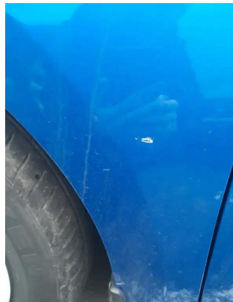
Фото №6. Дефекты эксплуатации