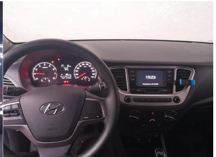
Фото №4. Общий вид