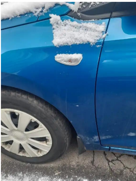
Фото №5. Дефекты эксплуатации