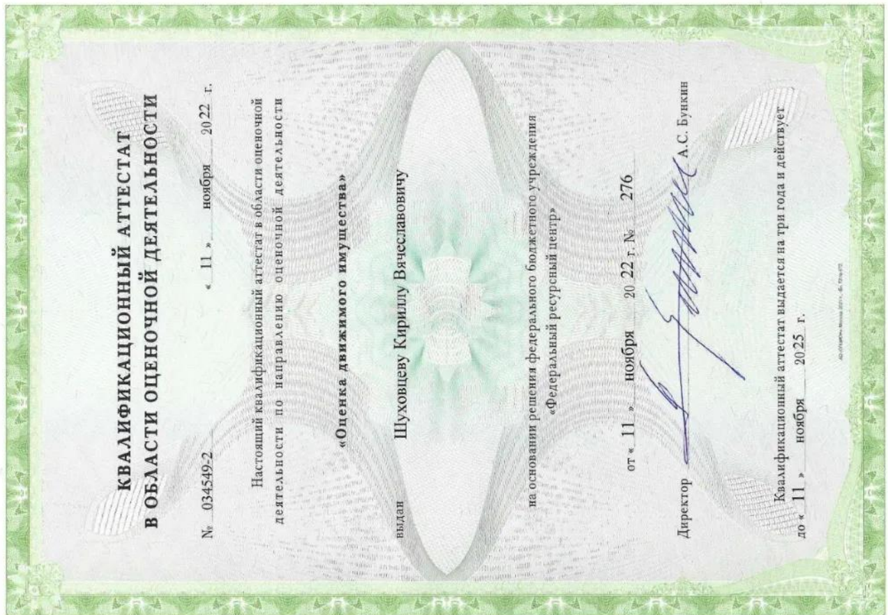
Квалификационный аттестат. Оценка движимого имущества