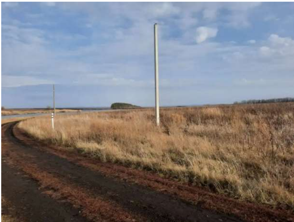
Фото №1. Общий вид участка