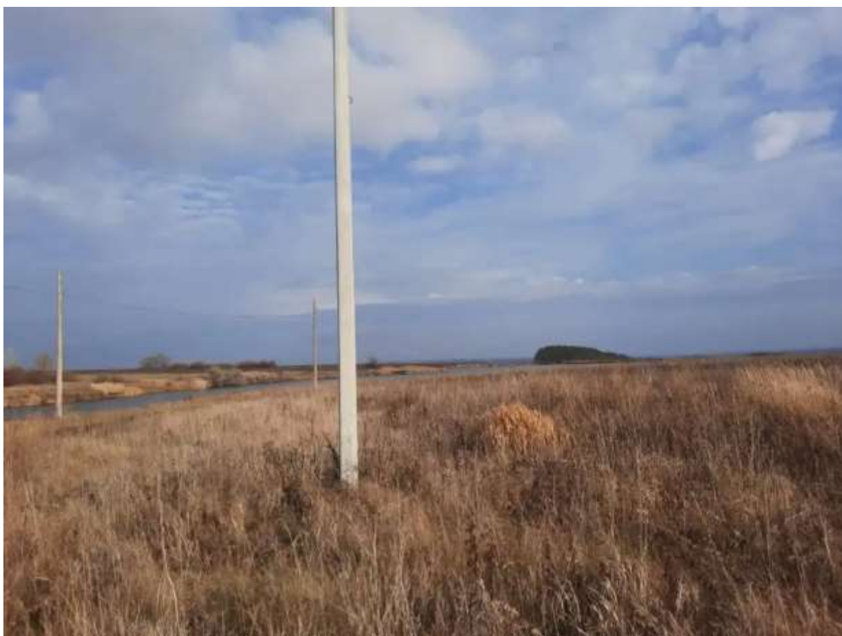
Фото №2. Общий вид участка