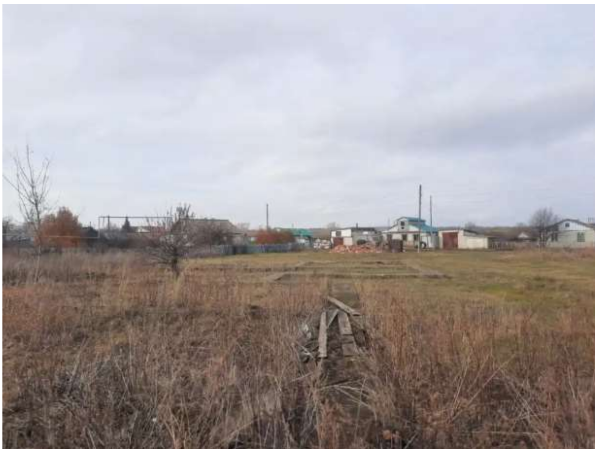
Фото №2. Общий вид участка