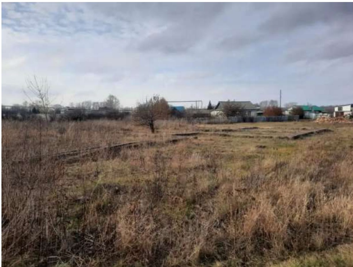
Фото №1. Общий вид участка