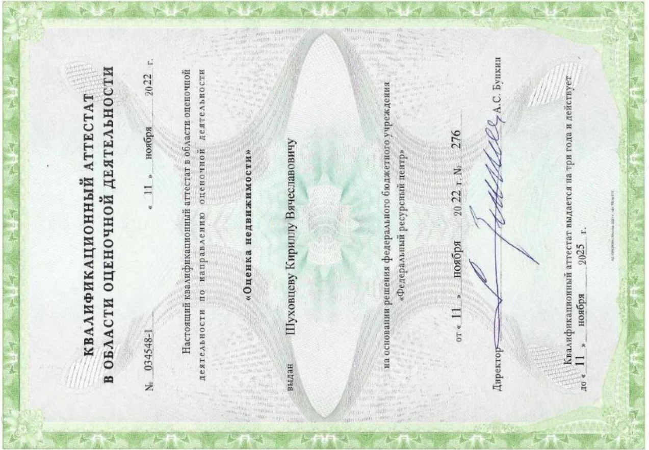
Квалификационный аттестат. Оценка недвижимости