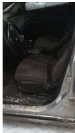
Фото №10. Общий вид