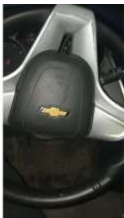
Фото №7. Общий вид