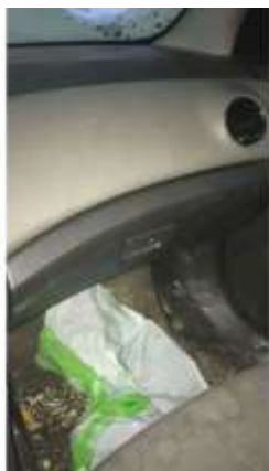
Фото №11. Общий вид