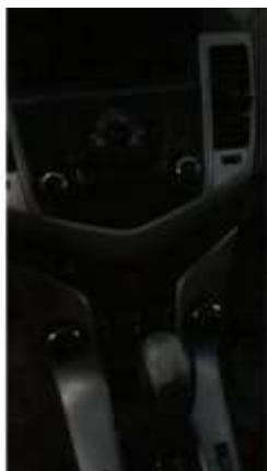
Фото №9. Общий вид