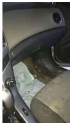
Фото №12. Общий вид