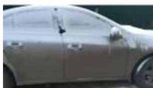
Фото №5. Общий вид