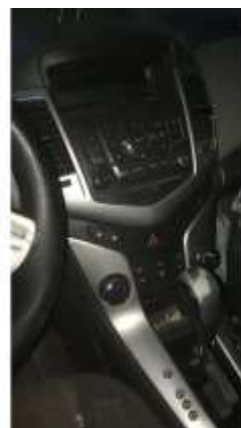
Фото №8. Общий вид