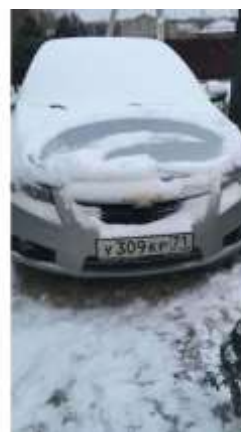
Фото №6. Общий вид