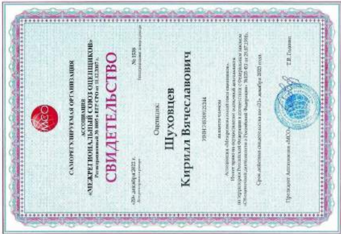
Свидетельство СРО оценщика