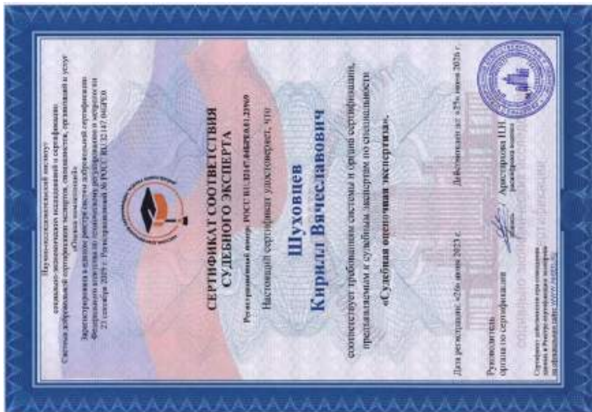
Сертификат соответствия судебного эксперта