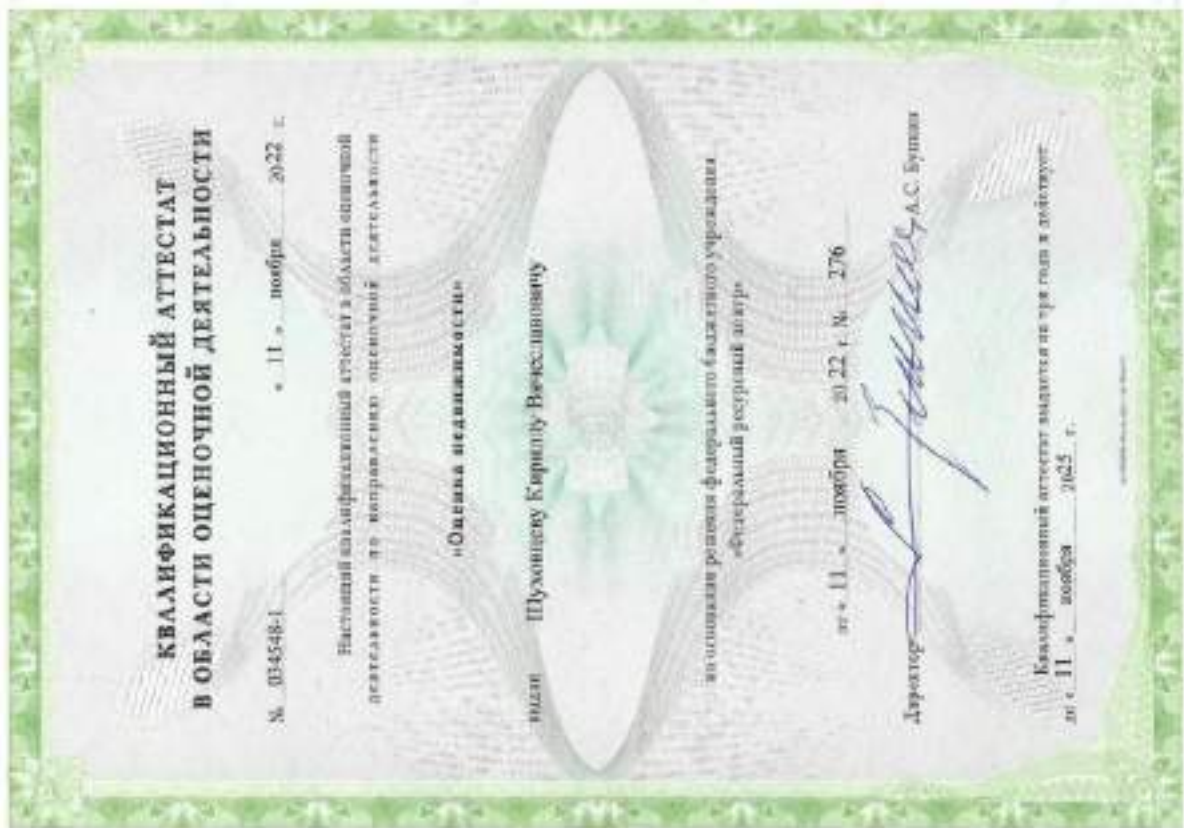
Квалификационный аттестат. Оценка недвижимости