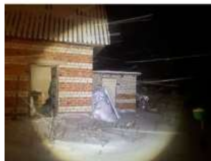
Фото №2. Фотографии здания