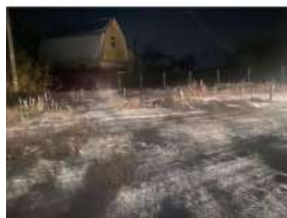
Фото №4. Фотографии участка