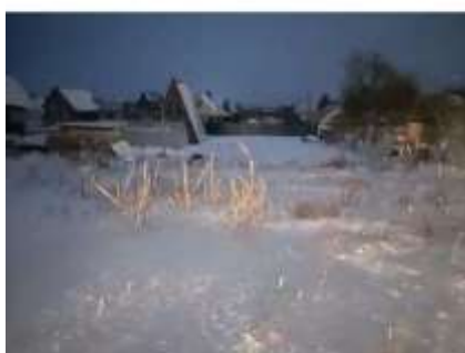
Фото №5. Фотографии участка