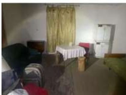
Фото №3. Фотографии здания