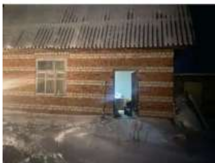
Фото №1. Фотографии здания