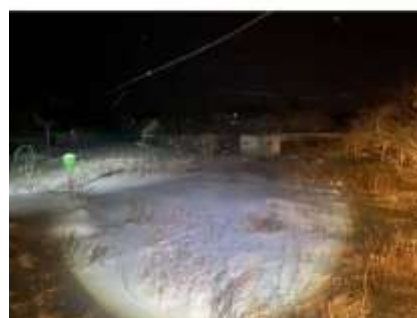
Фото №6. Фотографии участка