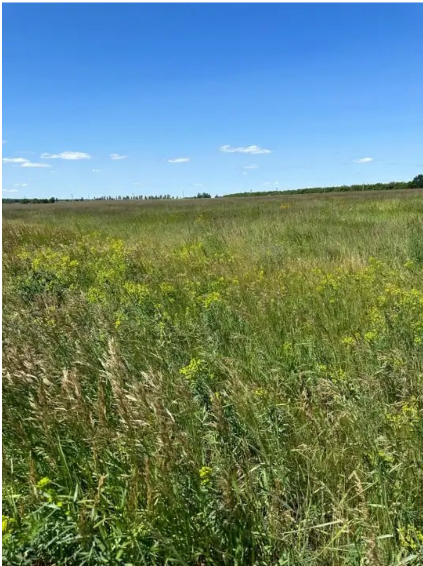
Фото №1. Общий вид участка