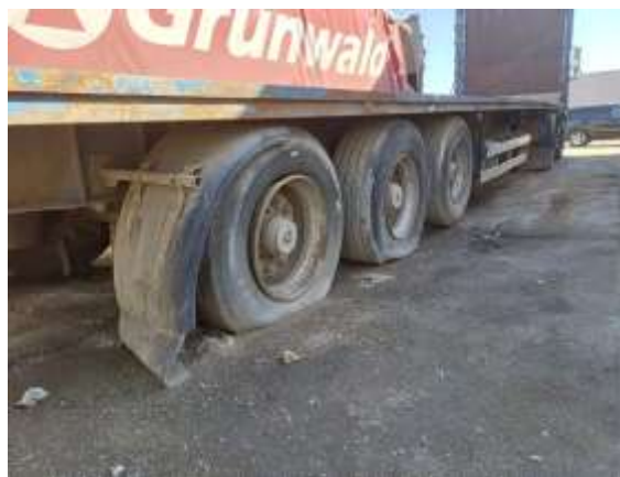
Фото №4. Общий вид