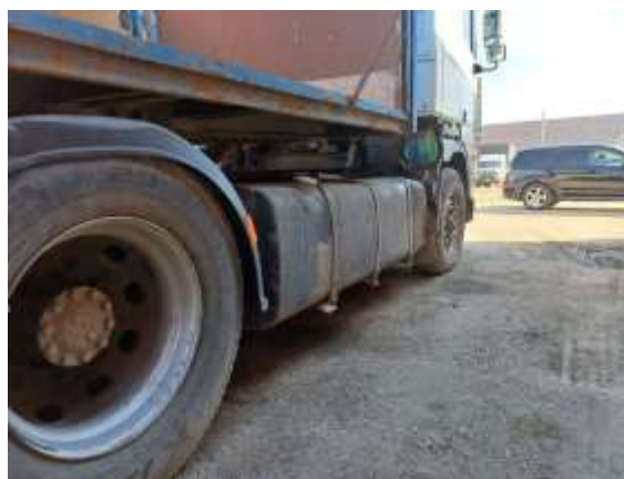
Фото №6. Общий вид