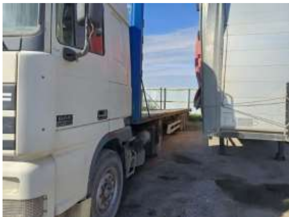
Фото №1. Общий вид