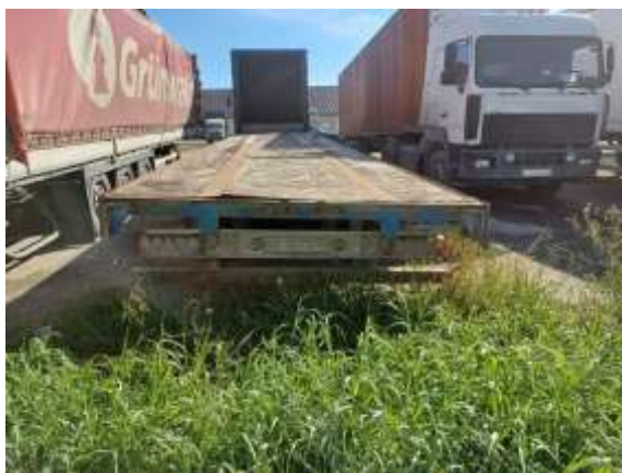
Фото №3. Общий вид