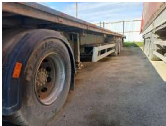
Фото №2. Общий вид