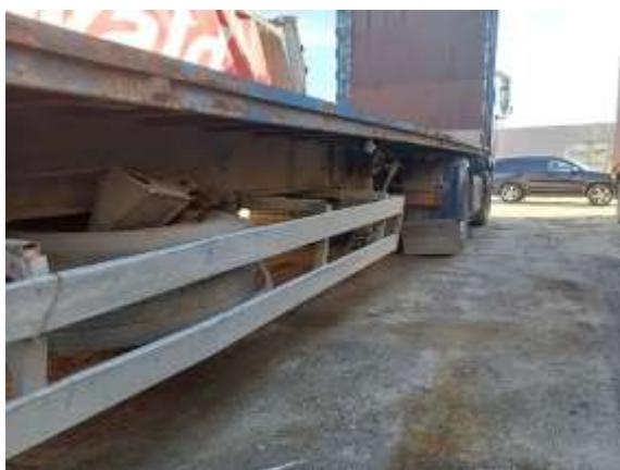
Фото №5. Общий вид