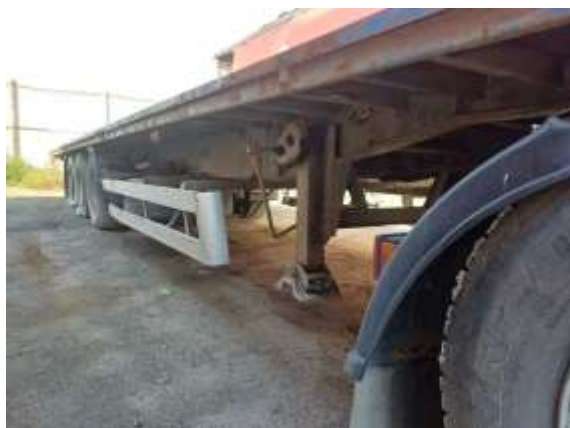
Фото №7. Общий вид