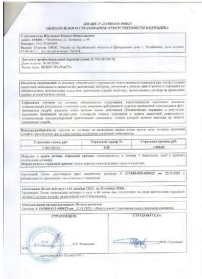
Полис страхования ответственности оценщика