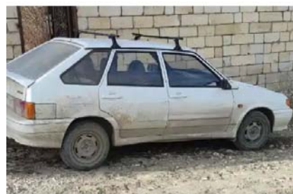
Фото №8. ФОТО ТС