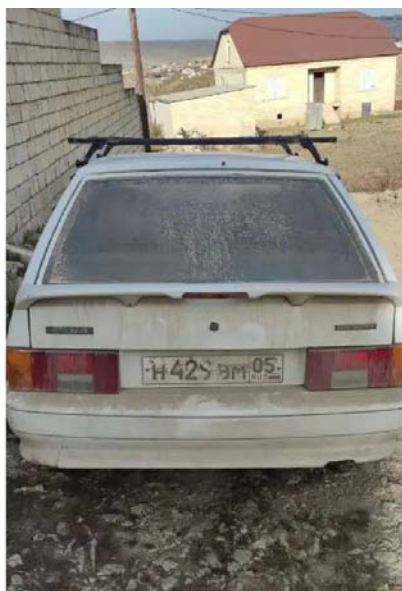
Фото №3. ФОТО ТС