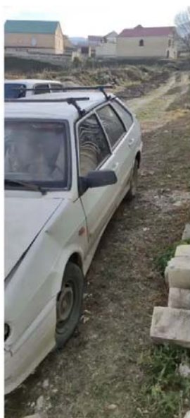
Фото №6.