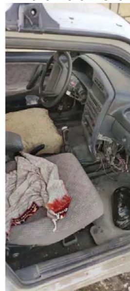
Фото №2.