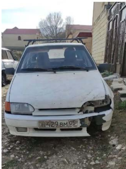
Фото №1. ФОТО ТС