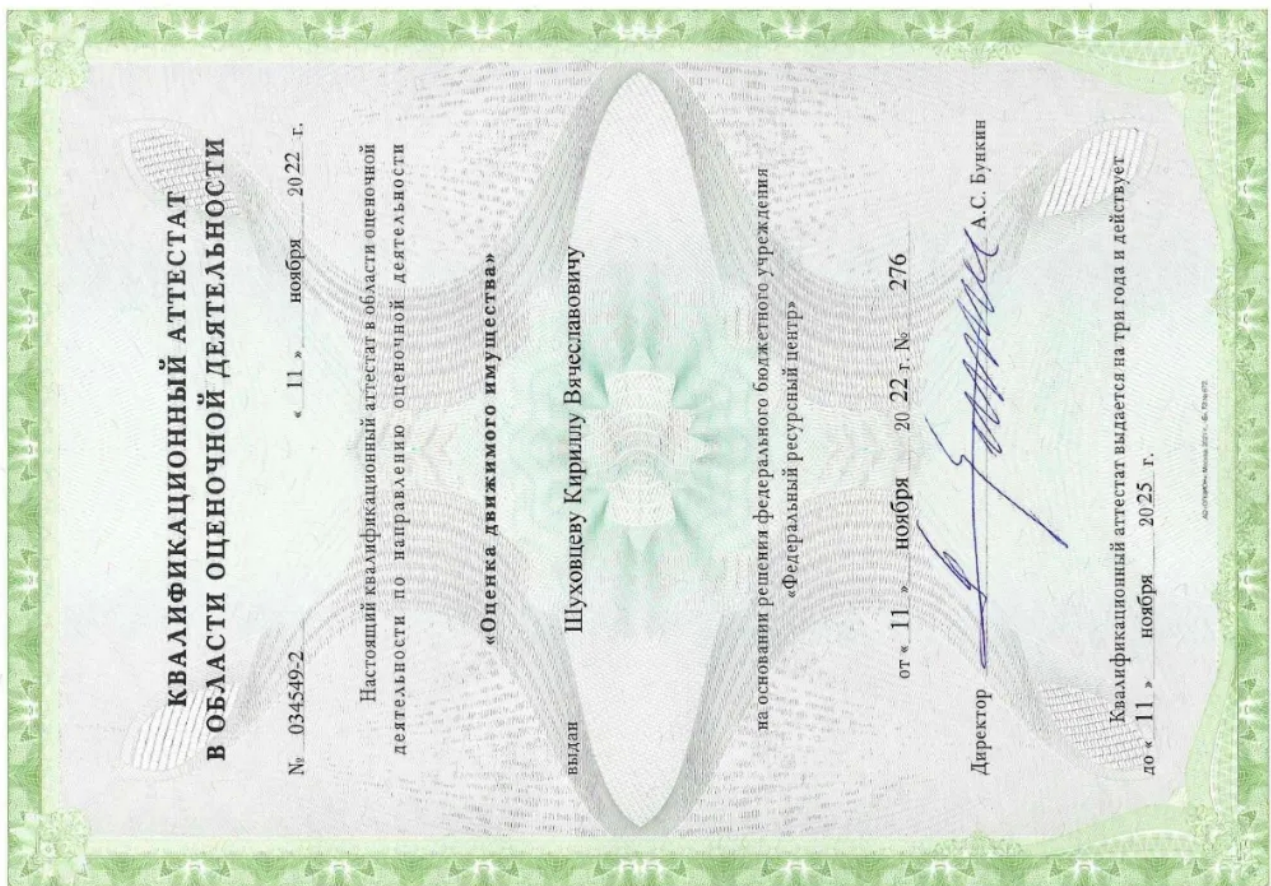
Квалификационный аттестат. Оценка движимого имущества