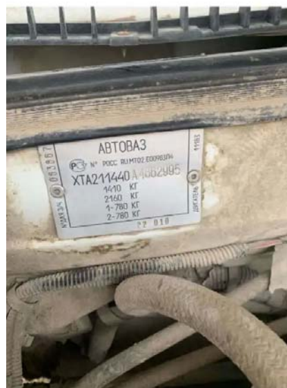
Фото №5. ФОТО ТС