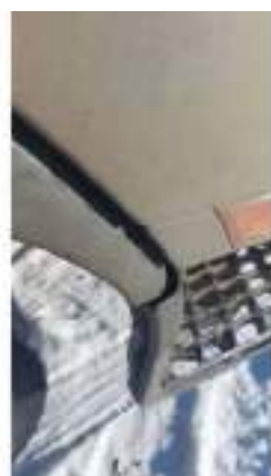
Фото №32. Фото грузового ТС Карева