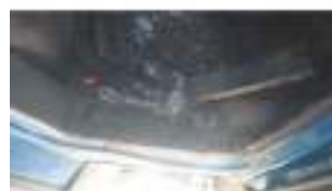
Фото №12. Фото грузового ТС Карева