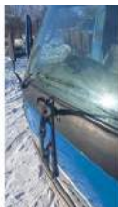
Фото №28. Фото грузового ТС Карева