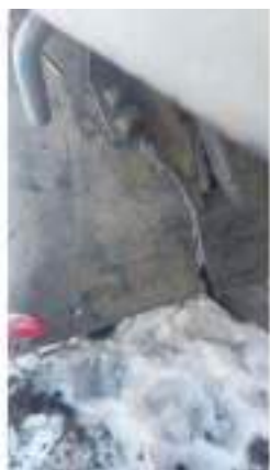
Фото №39. Фото грузового ТС Карева