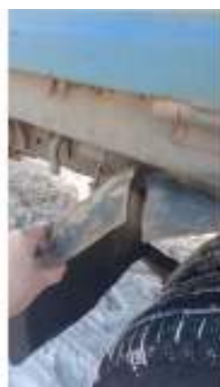
Фото №16. Фото грузового ТС Карева