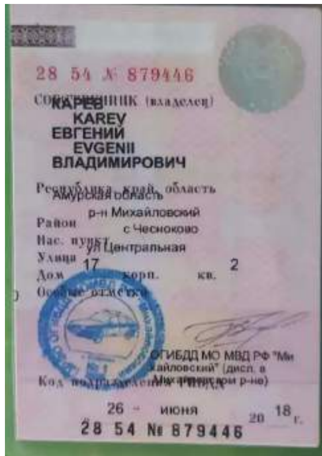
СТС-ки на ТС