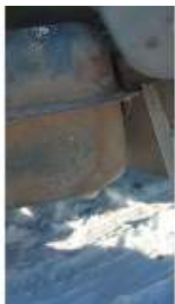
Фото №13. Фото грузового ТС Карева