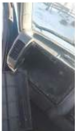
Фото №45. Фото грузового ТС Карева