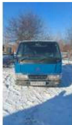
Фото №8. Фото грузового ТС Карева