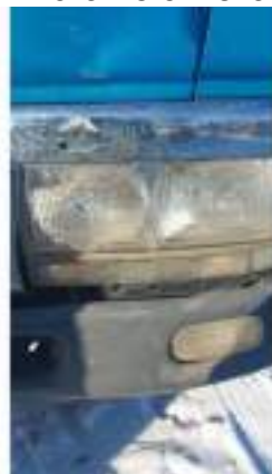
Фото №2. Фото грузового ТС Карева