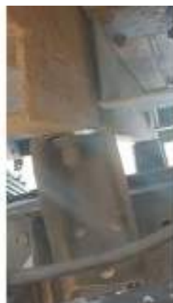
Фото №14. Фото грузового ТС Карева