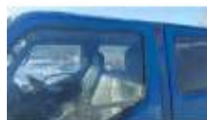
Фото №20. Фото грузового ТС Карева