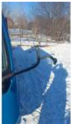
Фото №1. Фото грузового ТС Карева