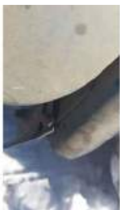
Фото №31. Фото грузового ТС Карева