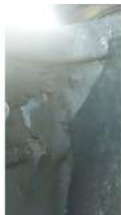
Фото №42. Фото грузового ТС Карева