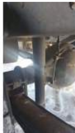
Фото №38. Фото грузового ТС Карева