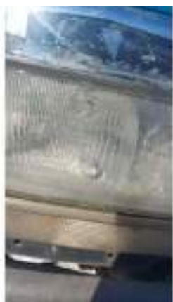
Фото №33. Фото грузового ТС Карева