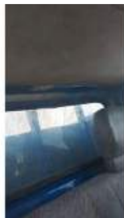
Фото №26. Фото грузового ТС Карева