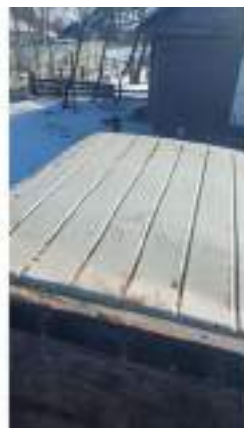
Фото №6. Фото грузового ТС Карева