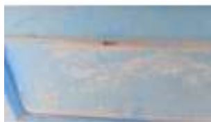
Фото №41. Фото грузового ТС Карева