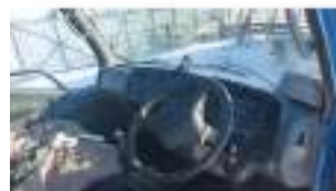
Фото №4. Фото грузового ТС Карева