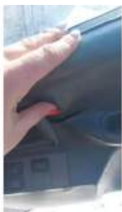
Фото №11. Фото грузового ТС Карева