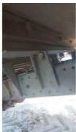
Фото №15. Фото грузового ТС Карева