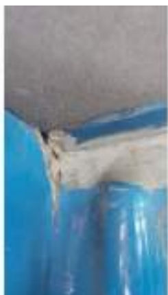
Фото №25. Фото грузового ТС Карева