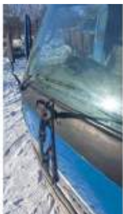
Фото №29. Фото грузового ТС Карева