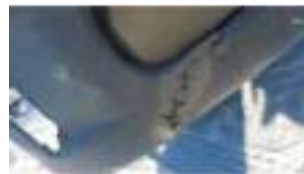
Фото №34. Фото грузового ТС Карева