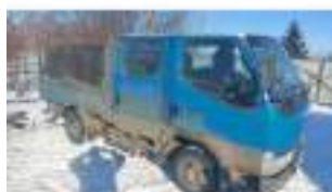
Фото №7. Фото грузового ТС Карева