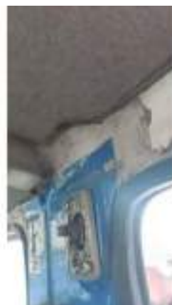
Фото №24. Фото грузового ТС Карева