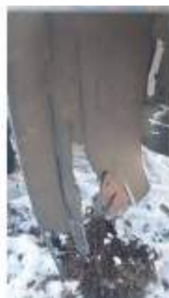
Фото №40. Фото грузового ТС Карева