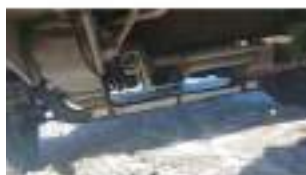
Фото №23. Фото грузового ТС Карева