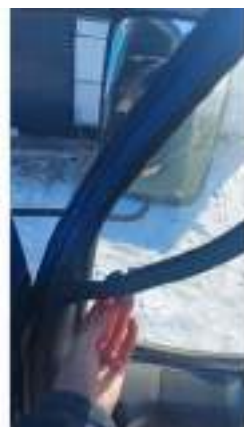
Фото №30. Фото грузового ТС Карева