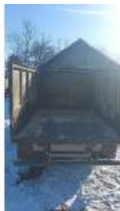
Фото №10. Фото грузового ТС Карева