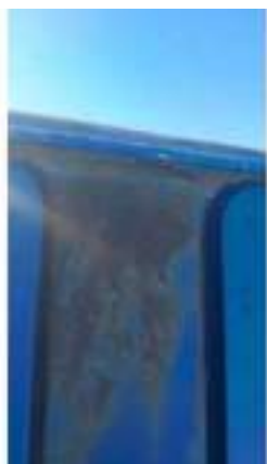
Фото №21. Фото грузового ТС Карева