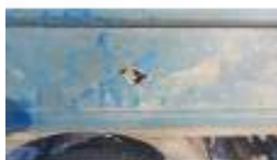
Фото №43. Фото грузового ТС Карева