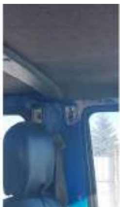
Фото №3. Фото грузового ТС Карева