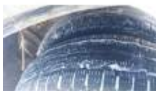
Фото №17. Фото грузового ТС Карева