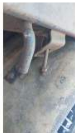
Фото №46. Фото грузового ТС Карева