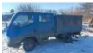
Фото №9. Фото грузового ТС Карева