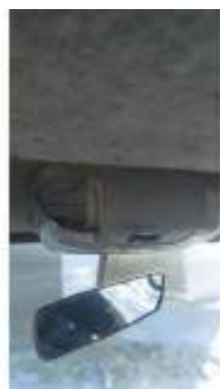
Фото №44. Фото грузового ТС Карева