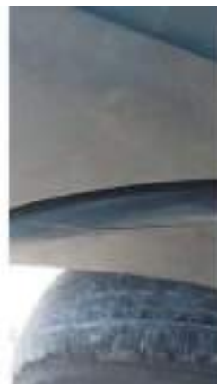
Фото №36. Фото грузового ТС Карева