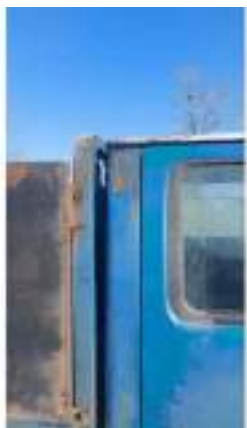
Фото №5. Фото грузового ТС Карева