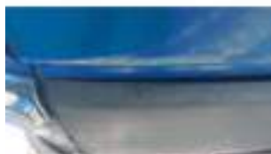
Фото №35. Фото грузового ТС Карева