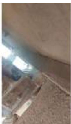
Фото №47. Фото грузового ТС Карева