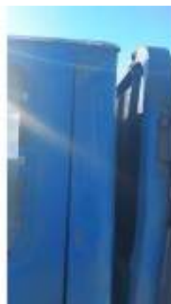
Фото №18. Фото грузового ТС Карева