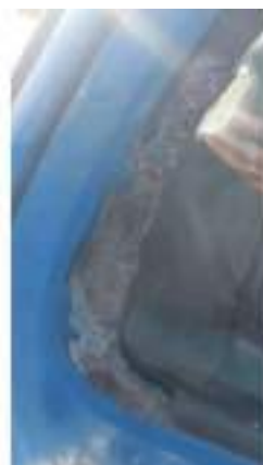
Фото №22. Фото грузового ТС Карева