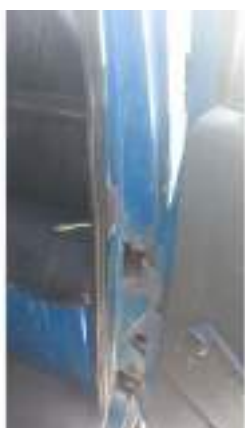
Фото №27. Фото грузового ТС Карева