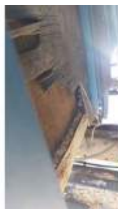
Фото №48. Фото грузового ТС Карева