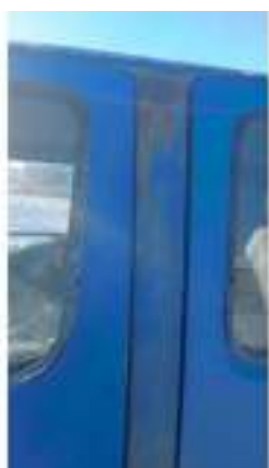
Фото №19. Фото грузового ТС Карева