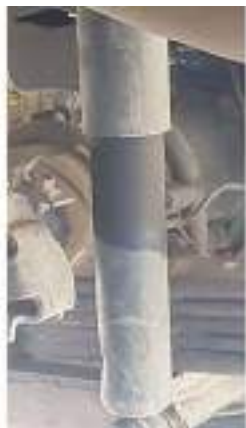
Фото №37. Фото грузового ТС Карева