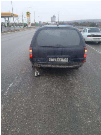
Общий вид ТС