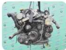
Двигатель 2.5 TDI Y25DT (M57 D25) Opel Omega B 45 000 ₽

Расходники Шины Ходовая часть Оптика КПП Двигатели