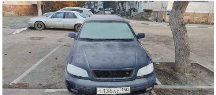
Общий вид ТС