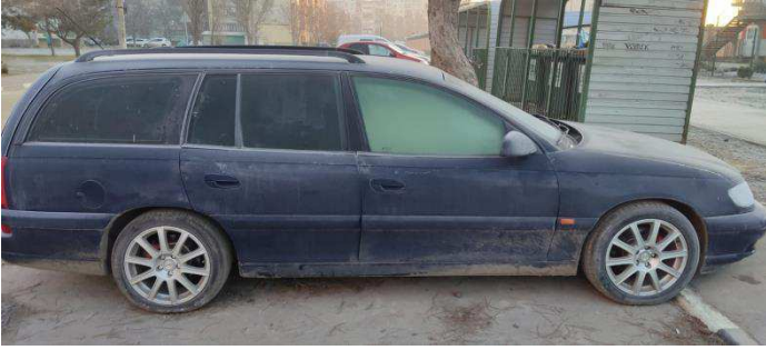
Общий вид ТС