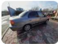
Kia Spectra, 2006 240 000 ₹