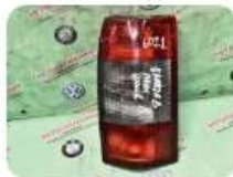
Задний фонарь правый OPEL Omega B дорестайл универсал 1 500 ₽