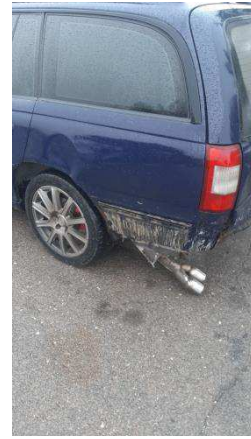
Общий вид ТС