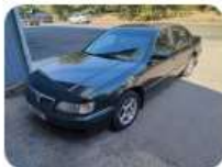
Nissan Maxima, 1998 250 000 ₹