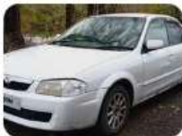
Mazda Familia, 1998 200 000 ₹