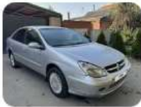
Citroen C5, 2003 250 000 ₹