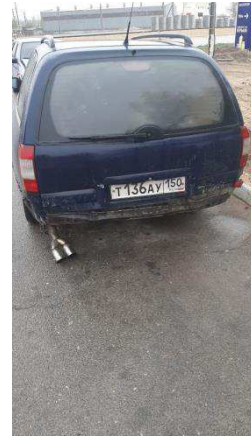
Общий вид ТС