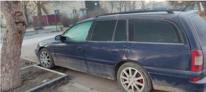
Общий вид ТС