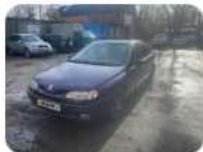
Renault Laguna, 1995 220 000 ₹