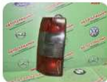
Задний фонарь левый OPEL Omega B дорестайл универсал 1 000 ₽