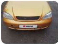
Opel Astra, 2001 220 000 ₹