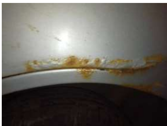
Фото №7. Дефекты эксплуатации