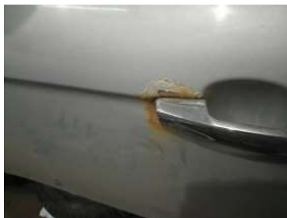
Фото №6. Дефекты эксплуатации