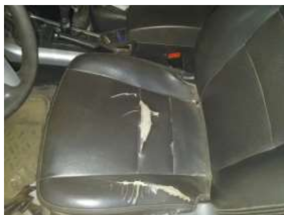
Фото №8. Дефекты эксплуатации