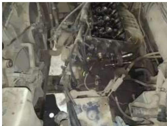
Фото №12. Дефекты эксплуатации