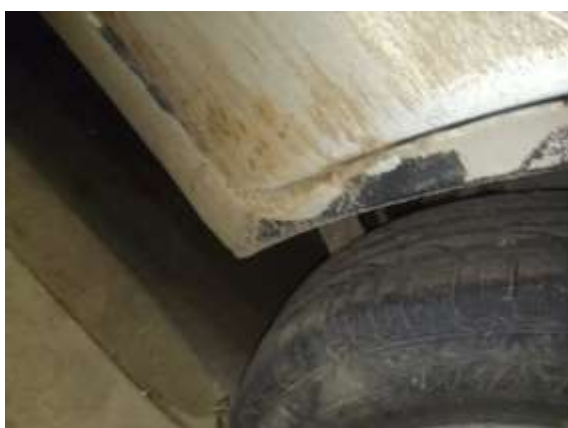
Фото №15. Дефекты эксплуатации