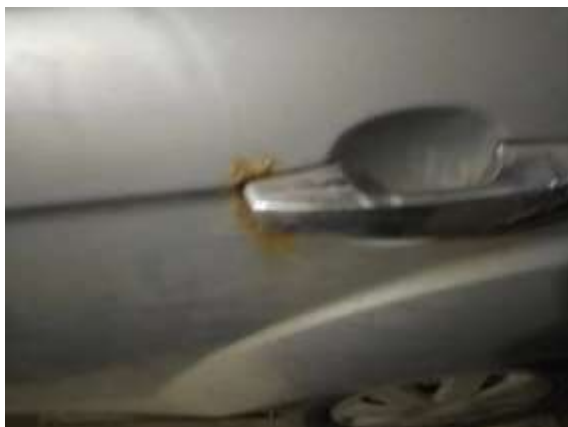
Фото №11. Дефекты эксплуатации