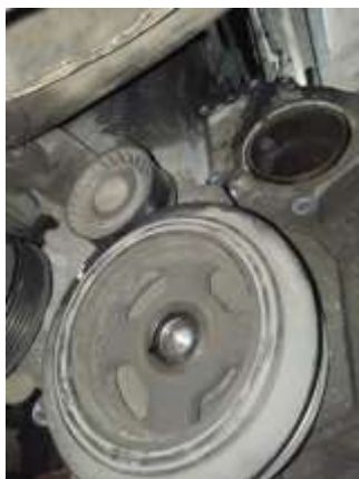
Фото №9. Дефекты эксплуатации