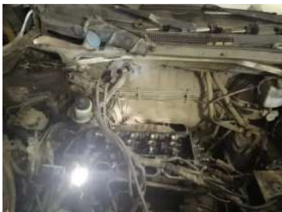
Фото №13. Дефекты эксплуатации