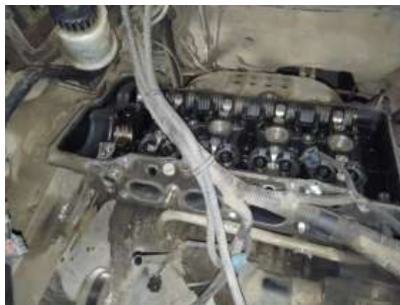
Фото №10. Дефекты эксплуатации