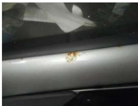
Фото №4. Дефекты эксплуатации