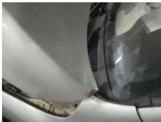
Фото №14. Дефекты эксплуатации