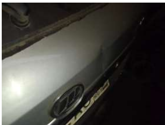
Фото №5. Дефекты эксплуатации