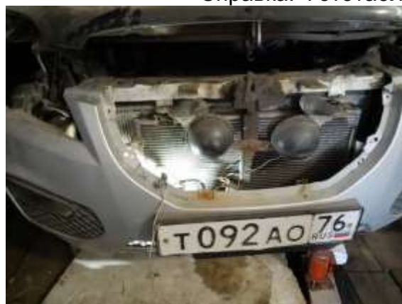
Фото №3. Общий вид