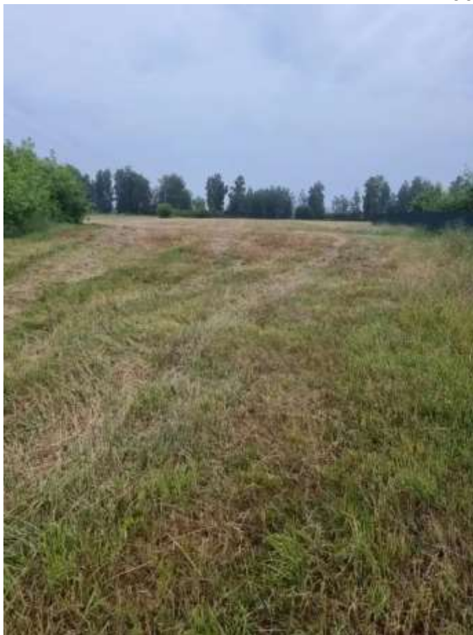
Фото №1. ЗУ

Выписка из отчета №1902242300. Фототаблица