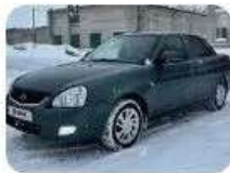
Лада Приора, 2010 345 000 ☐