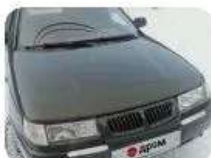
Лада 2112, 2006 310 000 ₹