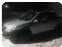
Лада Гранта, 2012 300 000 ☐