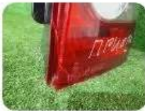
Фонарь с дефектами 1 000 ☐

Расходники Шины Ходовая часть Оптика Детали кузова