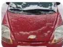
Chevrolet Spark, 2007 325 000 ₹