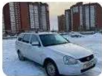
Лада Приора, 2012 285 000 ₹