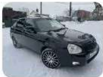
Лада Приора, 2010 345 000 ₹