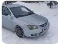
Kia Cerato, 2006 300 000 ☐