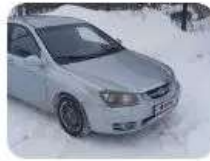
Kia Cerato, 2006 300 000 ₽