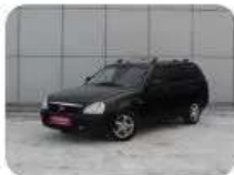
Лада Приора, 2010 350 000 ₹