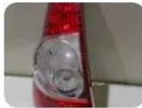
Фонарь с дефектом 1 500 ☐