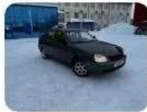
Лада Приора, 2008 257 000 ₽