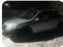
Лада Гранта, 2012 300 000 ☐