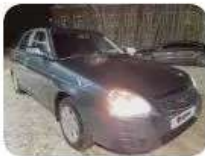
Лада Приора, 2009 260 000 ☐