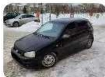
Лада Калина Спорт, 2010 310 000