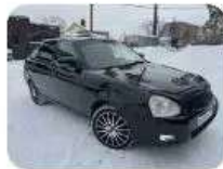
Лада Приора, 2010 345 000 ☐