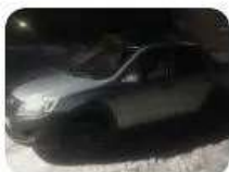
Лада Гранта, 2012 300 000 ₹