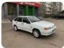
Лада 2114 Самара, 2013 345 000 ☐