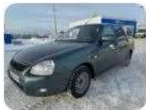
Лада Приора, 2010 305 000 ☐