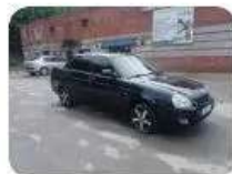
Лада Приора, 2009 340 000