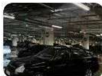
Лада Приора, 2009 330 000