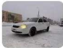
Лада Приора, 2012 285 000 ₽