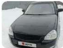
Лада Приора, 2008 285 000 ☐