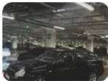
Лада Приора, 2009 330 000 ☐