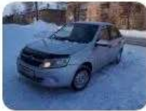
Лада Гранта, 2013 270 000 ☐