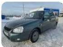
Лада Приора, 2010 305 000