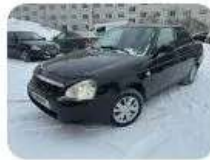
Лада Приора, 2009 265 000 ₽