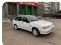
Лада 2114 Самара, 2013 345 000