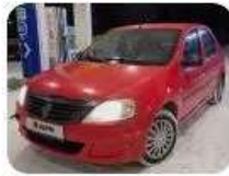
Renault Logan, 2012 298 000 ₽