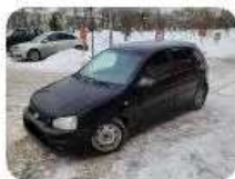
Лада Калина Спорт, 2010 310 000 ☐