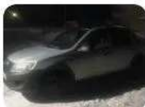
Лада Гранта, 2012 300 000