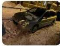
Kia Rio, 2004 280 000 ₽