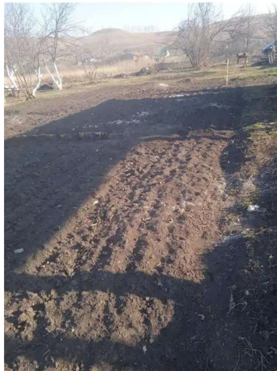
Фото №2. Общий вид участка