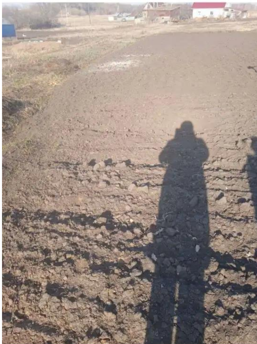
Фото №1. Общий вид участка