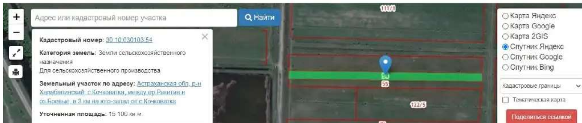
Фото №1. Общий вид участка со спутника на публичной кадастровой карте

Подсказка: Кликните на карте на любой участок или дом, чтобы проверить права собственности и обременения.