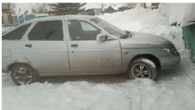
Фото №3. Общий вид