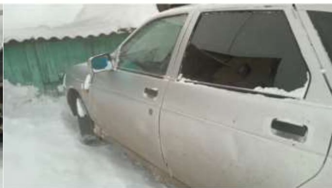
Фото №2. Общий вид