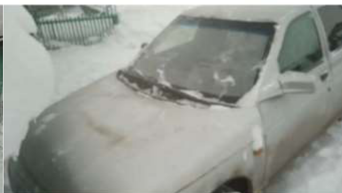
Фото №4. Общий вид