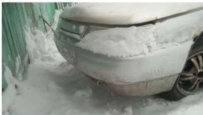
Фото №1. Общий вид