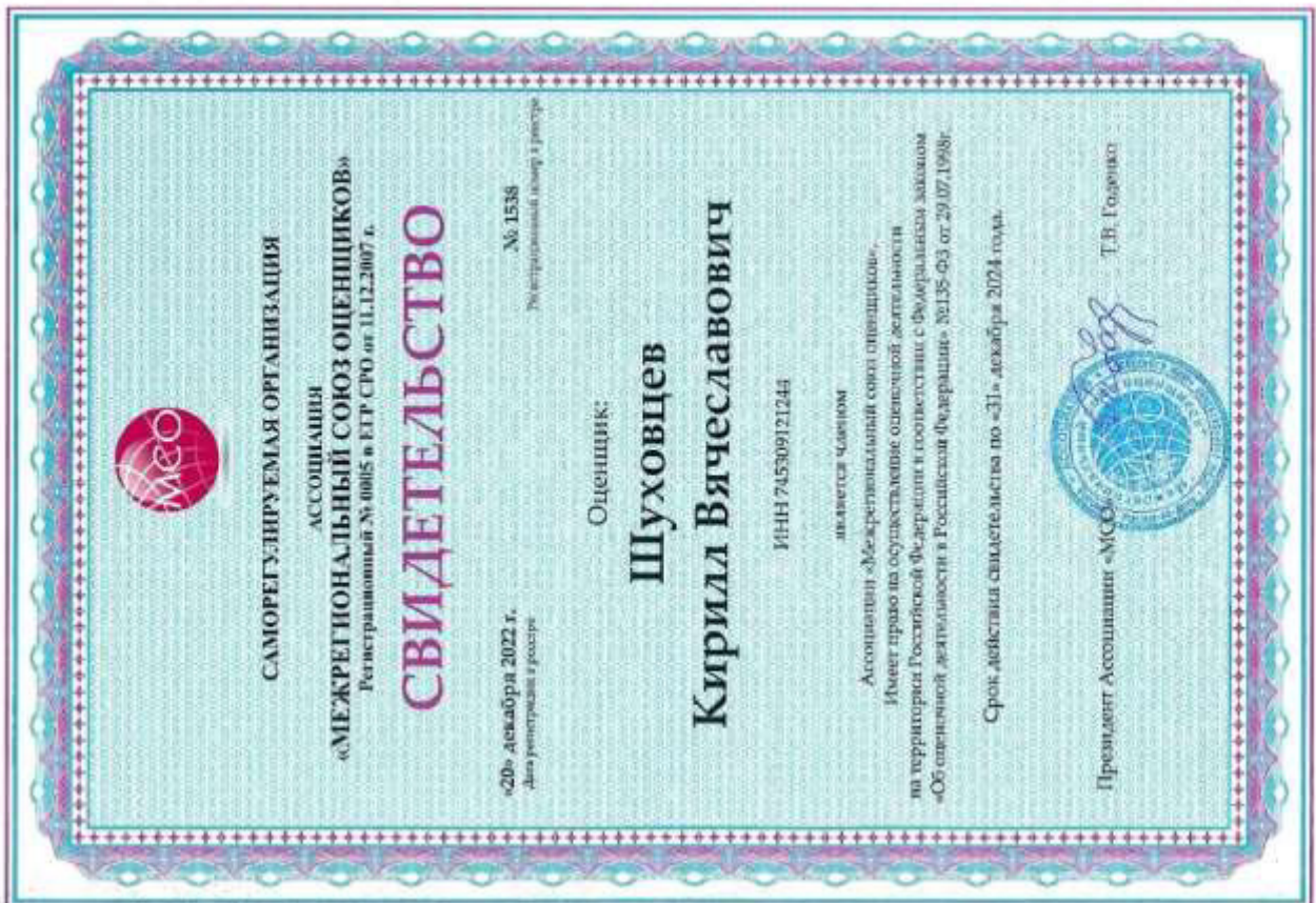
Свидетельство СРО оценщика