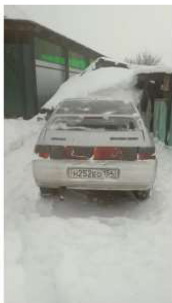
Фото №5. Общий вид