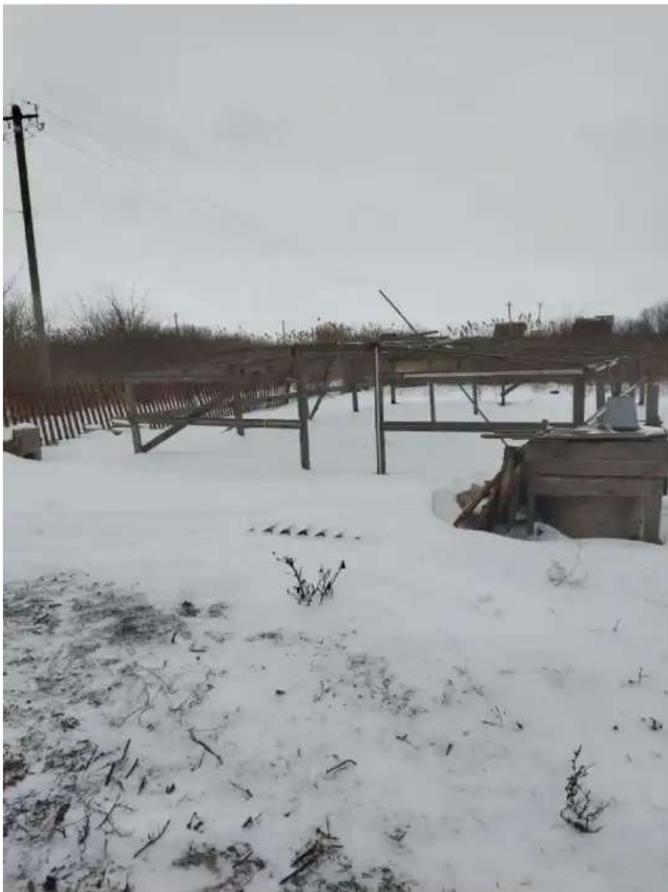
Фото №1. Общий вид участка