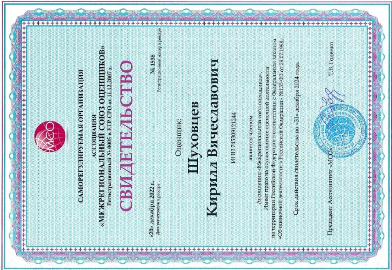
Свидетельство СРО оценщика