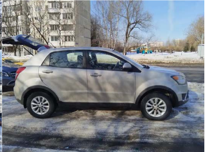
Фото №1. image-1c2e78e8-5511-40a2-a350-dadfc90ceb3b