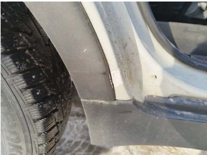
Фото №5. image-f1c586ac-90df-4c6f-aefe-a4173ab3fe95