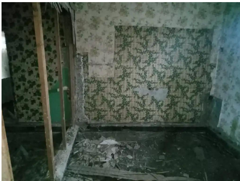
Фото №7. Общий вид дома