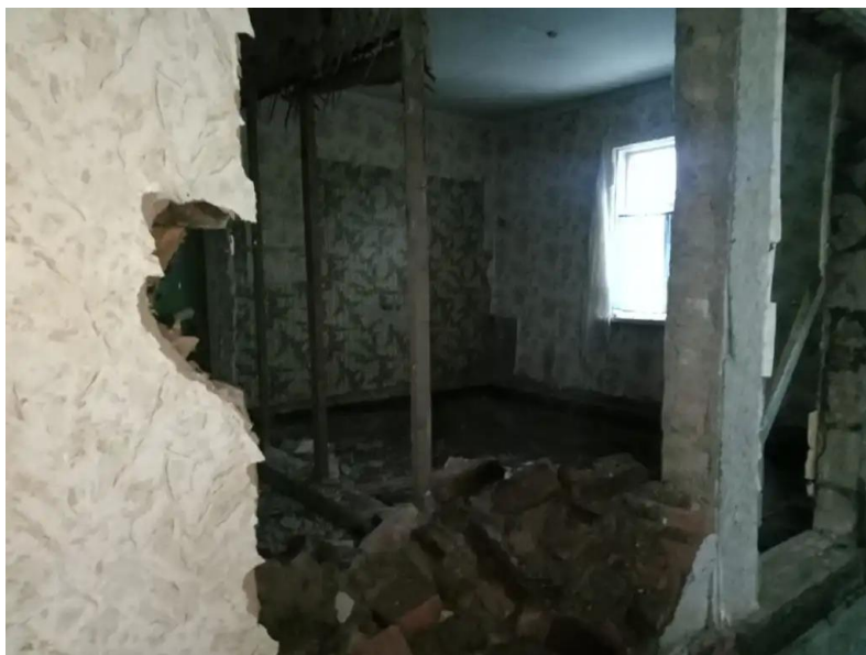
Фото №3. Общий вид дома