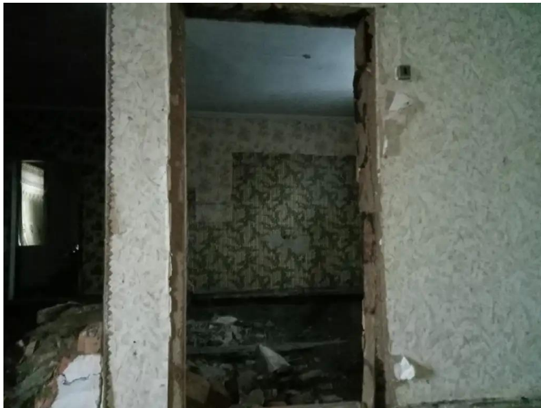
Фото №5. Общий вид дома