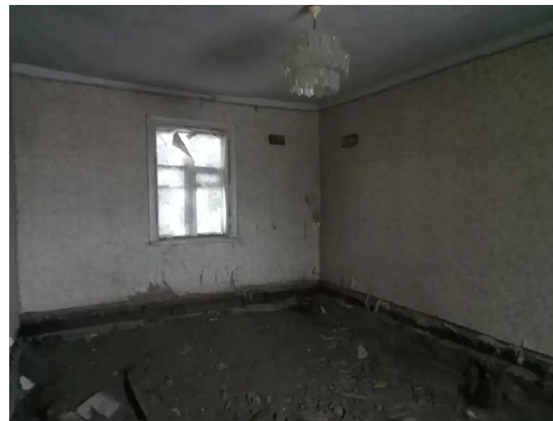
Фото №4. Общий вид дома