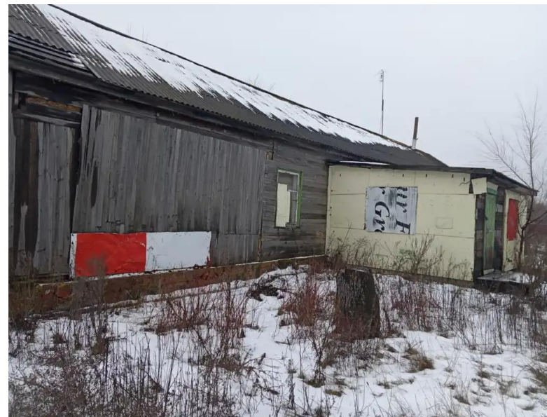
Фото №2. Общий вид дома