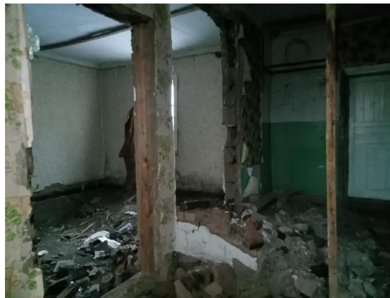
Фото №8. Общий вид дома