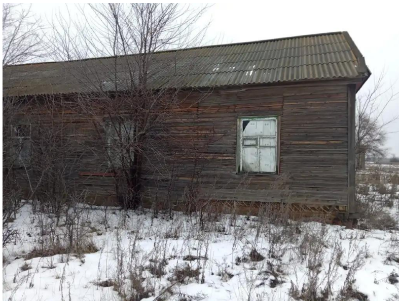
Фото №1. Общий вид дома