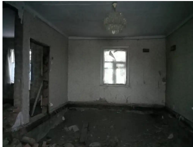
Фото №6. Общий вид дома