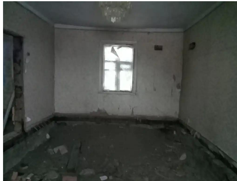
Фото №10. Общий вид дома