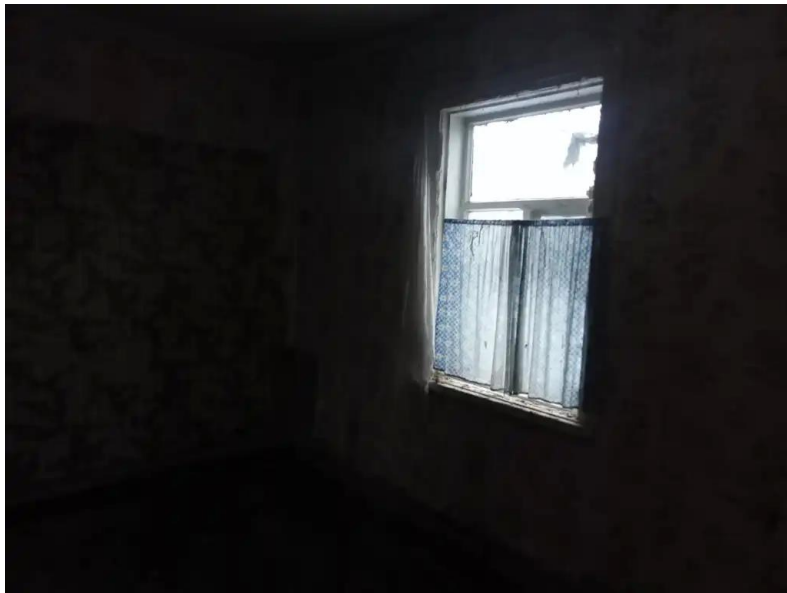
Фото №9. Общий вид дома