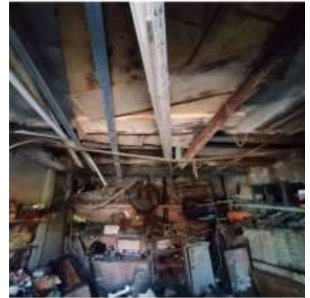
Фото №5. Фото гаража