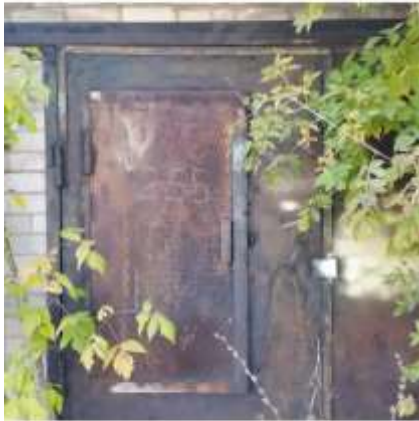
Фото №3. Фото гаража