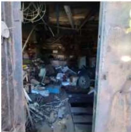
Фото №6. Фото гаража