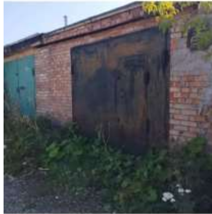
Фото №4. Фото гаража