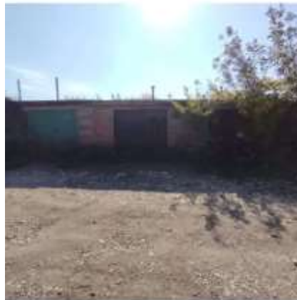
Фото №7. Фото гаража