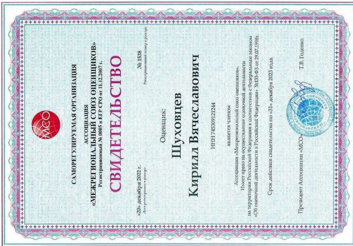
Свидетельство СРО оценщика