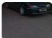
Лада 2113 Самара, 2007 200 000 Р