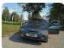
Лада 2115 Самара, 2011 200 000 Р