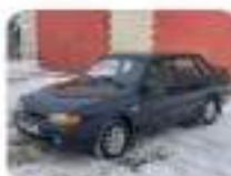
Лада 2115 Самара, 2007 200 000 Р