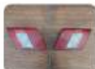
Запчасти фары на Лада 2114 700 Р