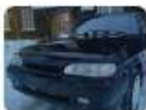
Лада 2114 Самара, 2010 180 000 Р