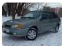
Лада 2113 Самара, 2011 160 000 Р