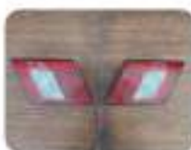
Задние фонари лад 2115 700 Р