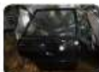
Лада 2114 - 2115 Дверь задняя правая 4 500 Р