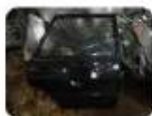
Lada 2114 - 2115 Дверь задняя правая