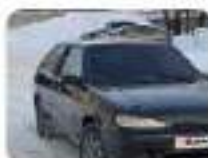
Лада 2113 Самара, 2006 140 000 Р