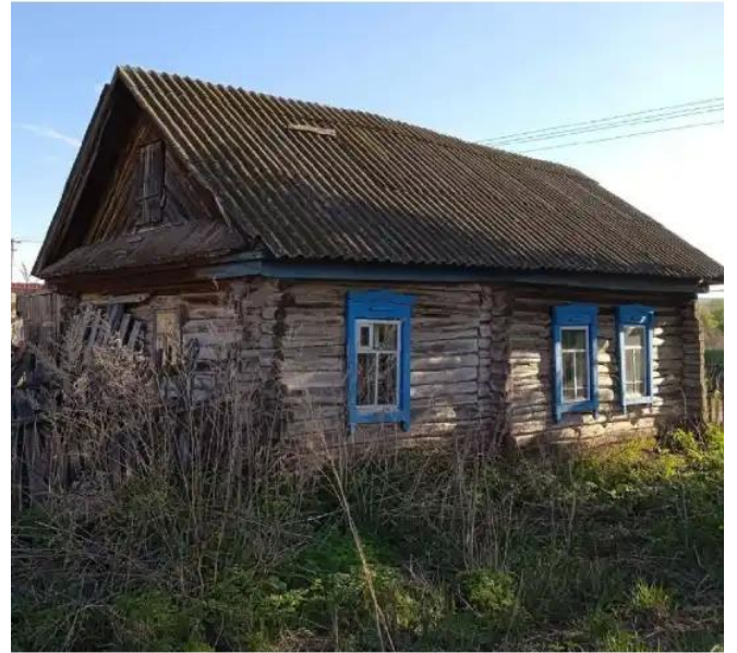
Фото №2. Общий вид дома на участке