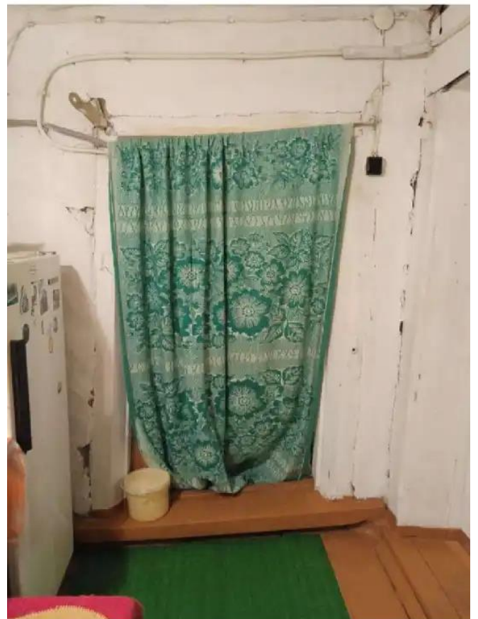
Фото №8. Общий вид дома