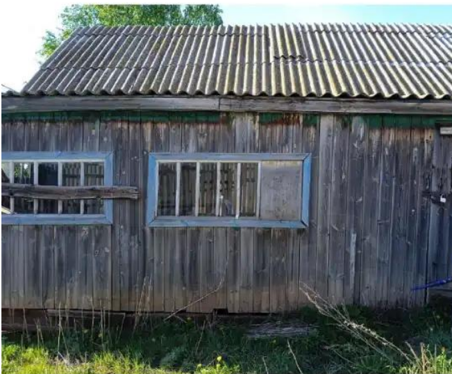
Фото №3. Общий вид дома