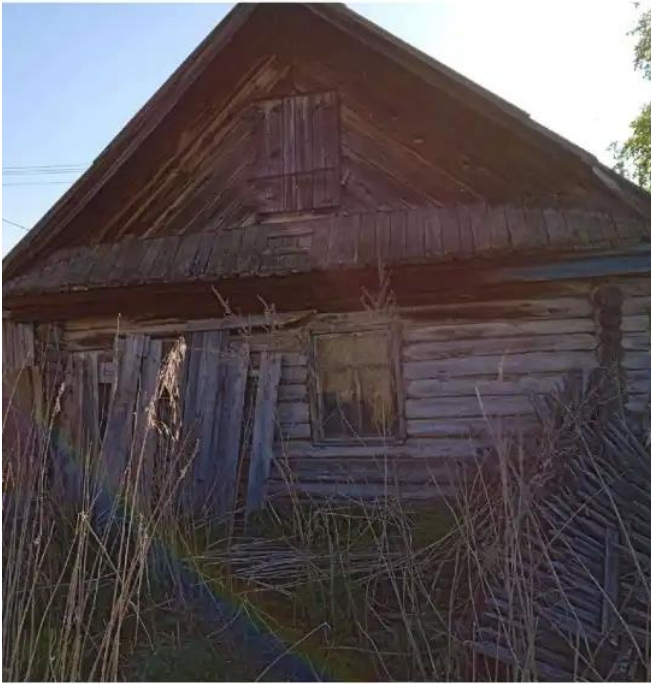
Фото №1. Общий вид дома