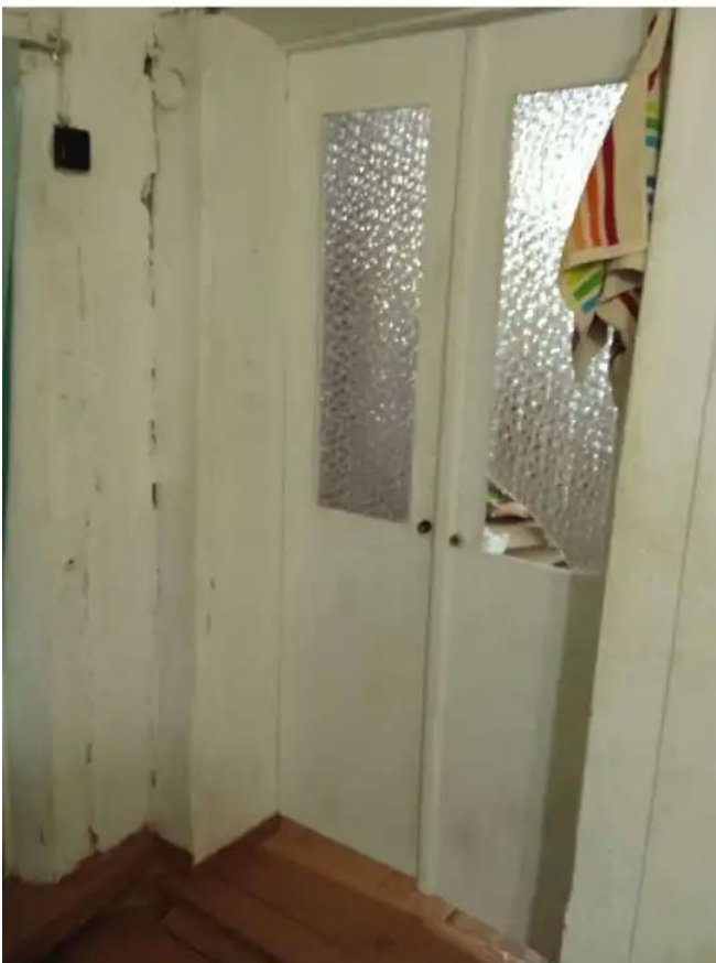
Фото №7. Общий вид дом