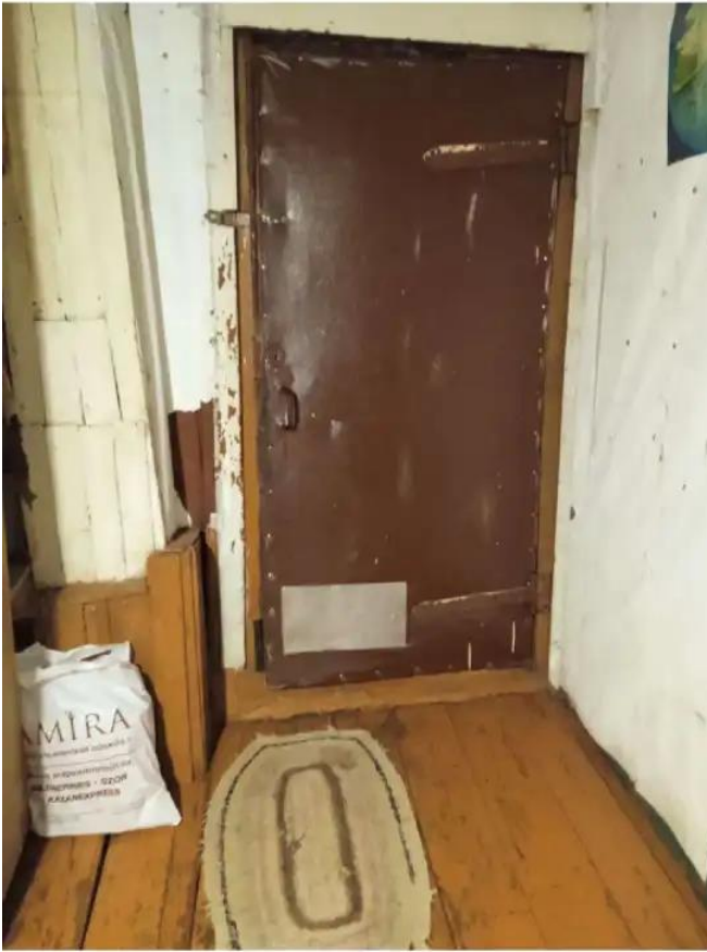
Фото №5. Общий вид дома