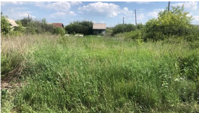
Фото №3. Фото ЗУ