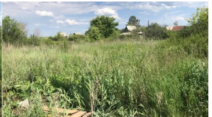
Фото №4. Фото ЗУ