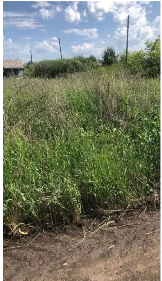
Фото №2. Фото ЗУ