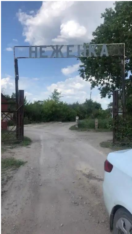
Фото №1.