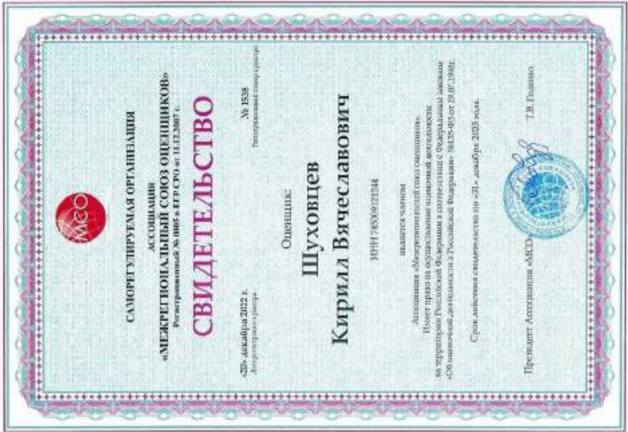
Свидетельство СРО оценщика