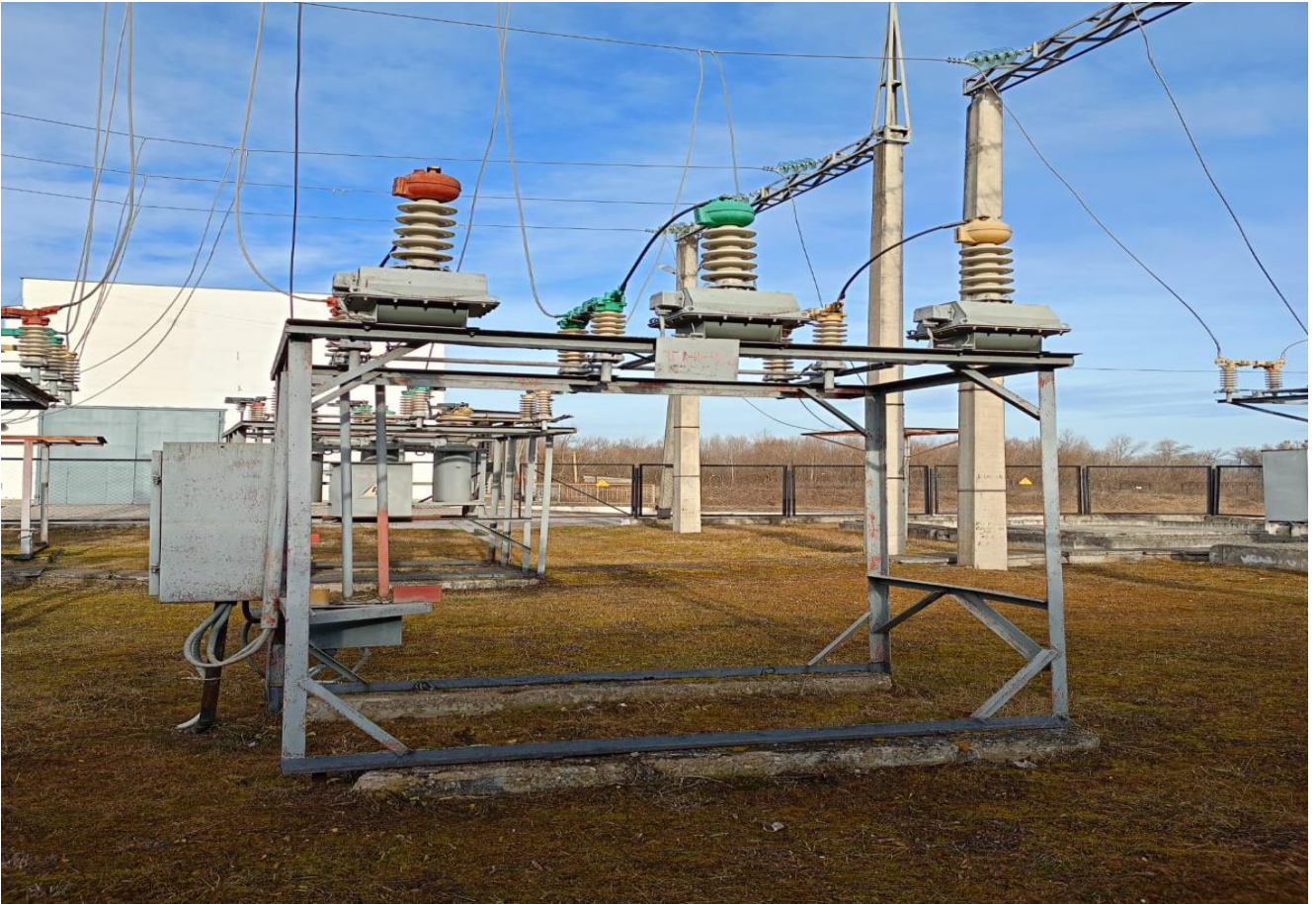
Система возбуждения тиристорная ГАЗ Малая ГЭС-3