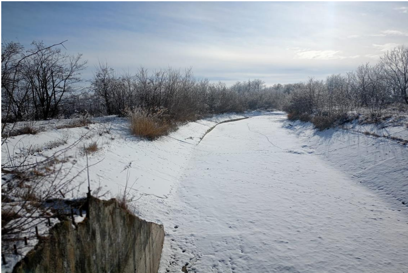
Напорный трубопровод ГЭС-3