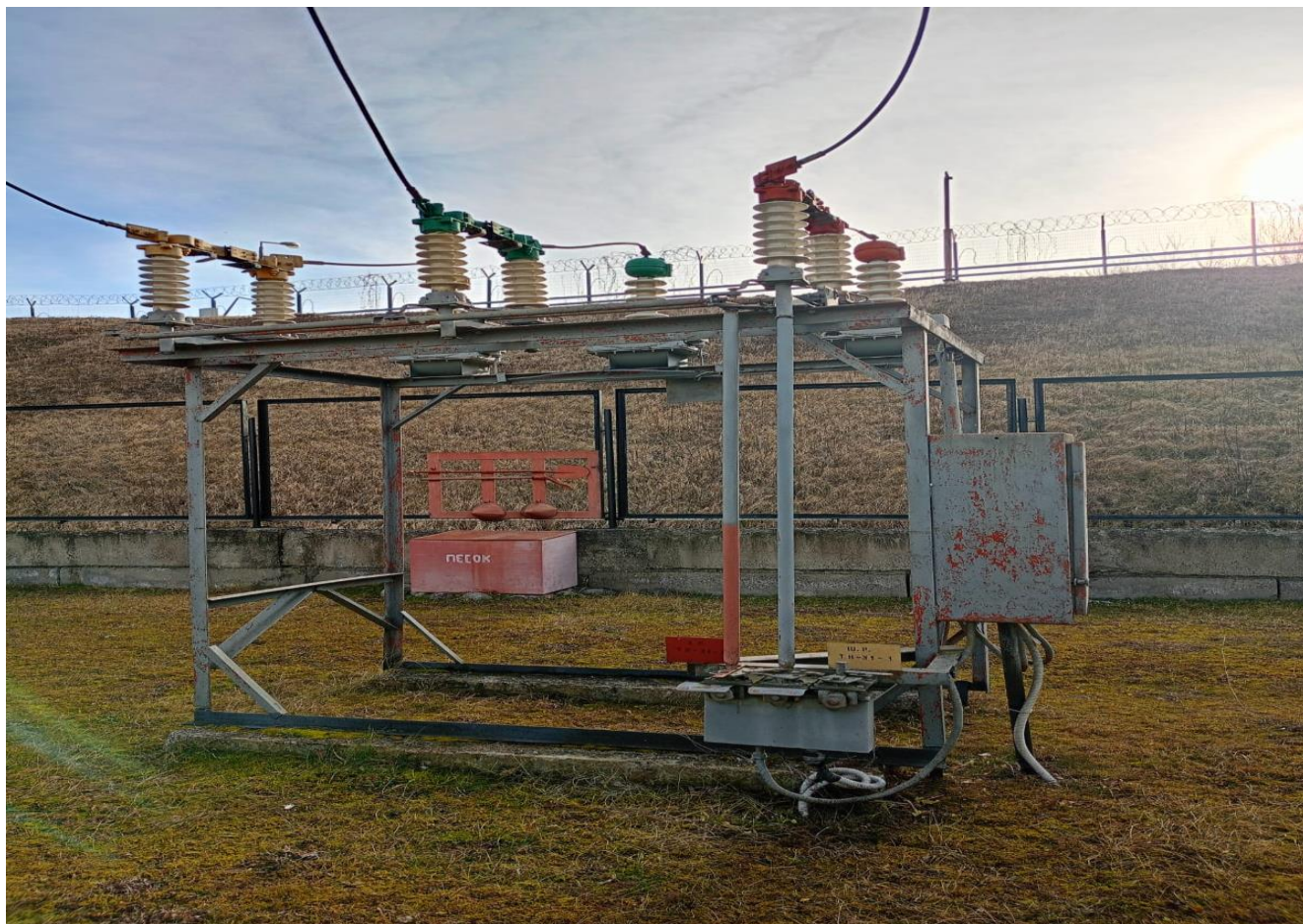
Разъединитель высоковольтный РДЗ1Б-35/630 ГЭС 3 Л-473-1