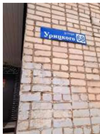
Фото №16. Общий вид дома и придомовая территория