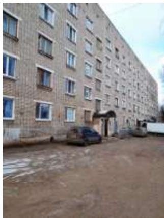
Фото №17. Общий вид дома и придомовая территория