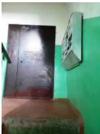
Фото №9. Места общего пользования