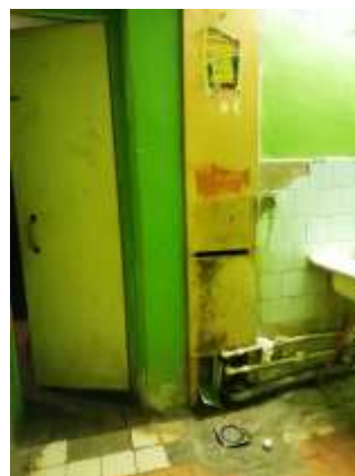
Фото №8. Места общего пользования