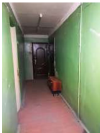
Фото №7. Места общего пользования