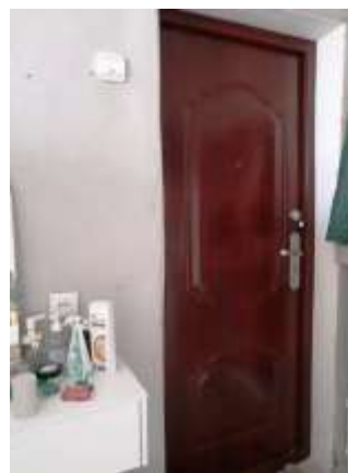
Фото №4. Комната