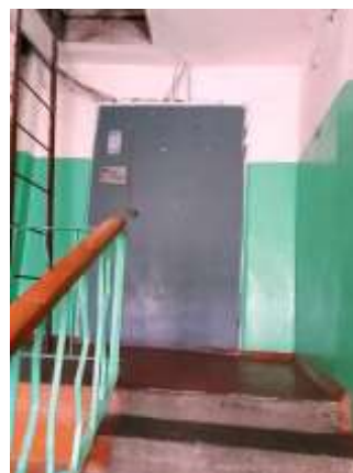
Фото №14. Места общего пользования