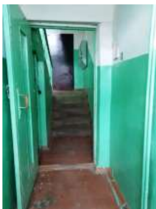
Фото №15. Места общего пользования