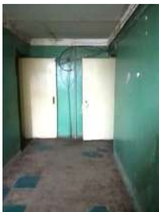
Фото №13. Места общего пользования