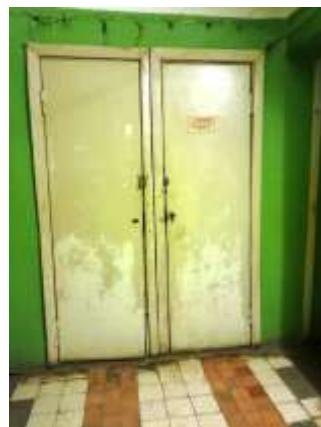
Фото №12. Места общего пользования