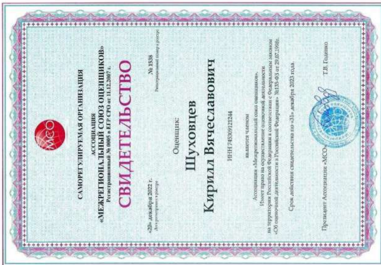
Свидетельство СРО оценщика