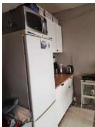
Фото №5. Комната