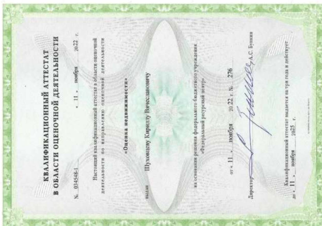
Квалификационный аттестат. Оценка недвижимости