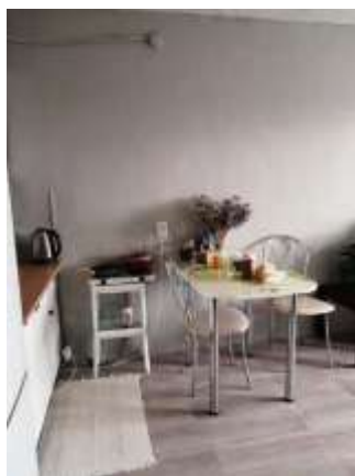
Фото №3. Комната