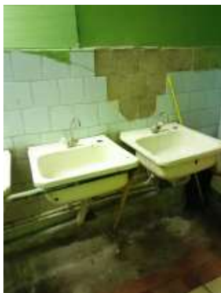
Фото №11. Места общего пользования