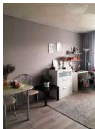
Фото №6. Комната