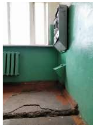
Фото №10. Места общего пользования