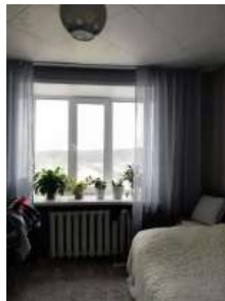
Фото №2. Комната