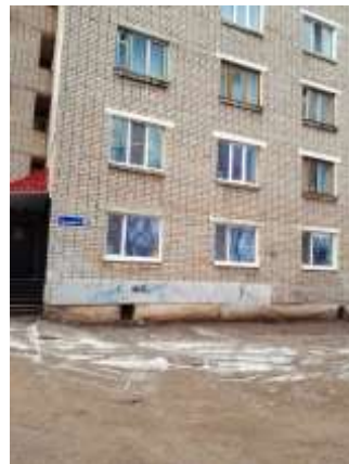
Фото №18. Общий вид дома и придомовая территория