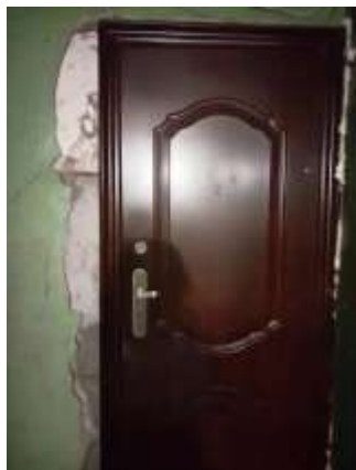
Фото №1. Входная дверь