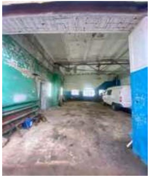
Гараж: служебное здание