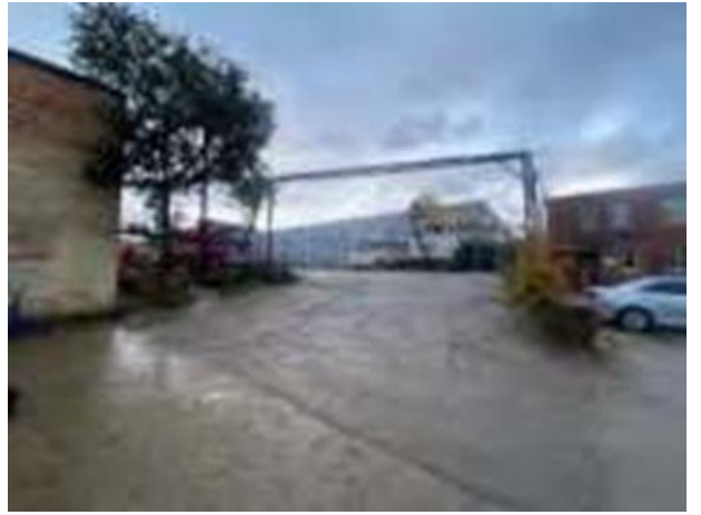
Гараж: здание бокса №4