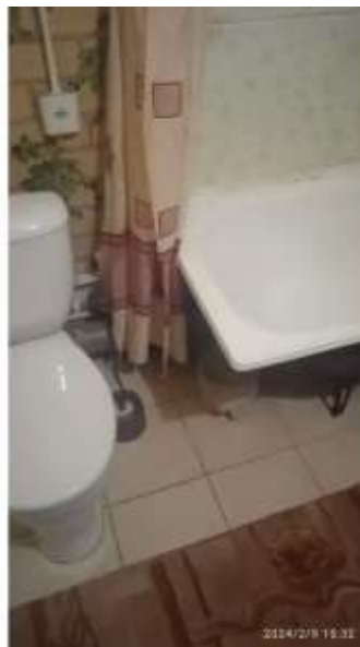
Фото №2. Санузел