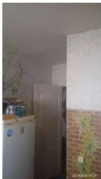
Фото №4. Кухня