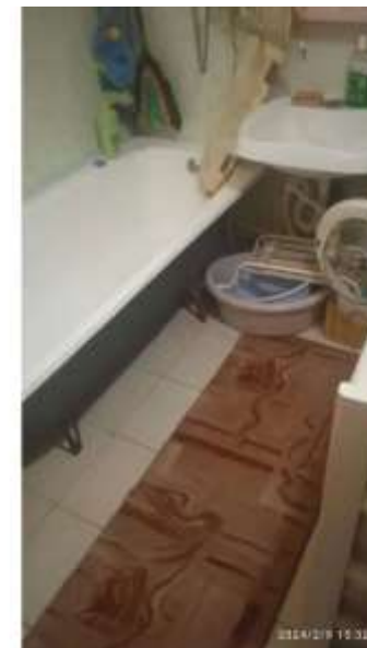
Фото №3. Санузел