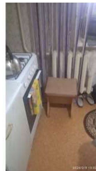
Фото №6. Кухня