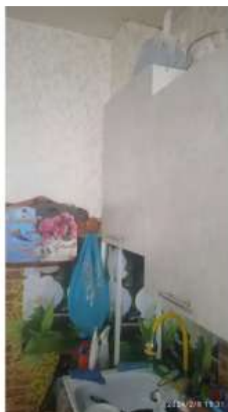
Фото №5. Кухня