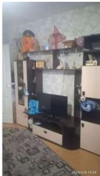
Фото №1. Комната