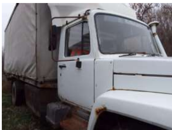
Фото №7. Общий вид