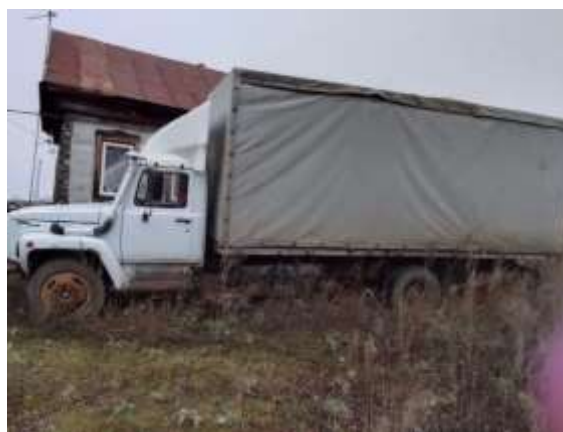
Фото №6. Общий вид