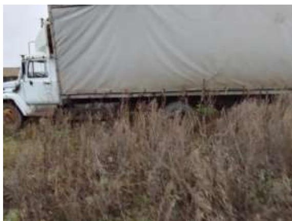
Фото №5. Общий вид