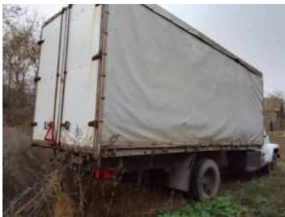
Фото №3. Общий вид