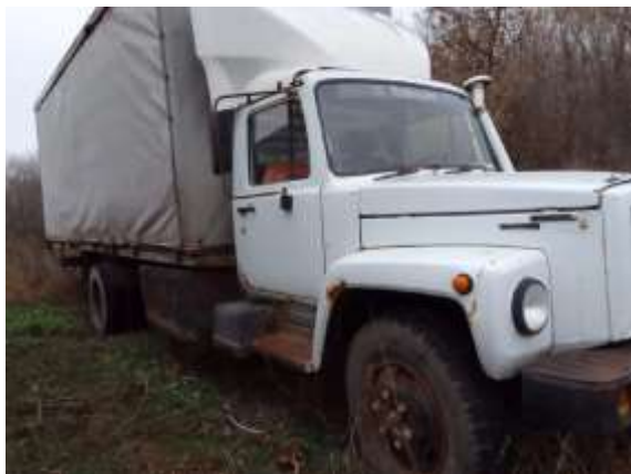
Фото №1. Общий вид