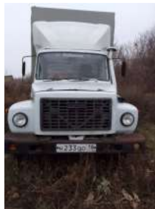
Фото №2. Общий вид