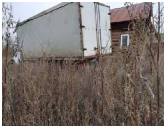
Фото №4. Общий вид