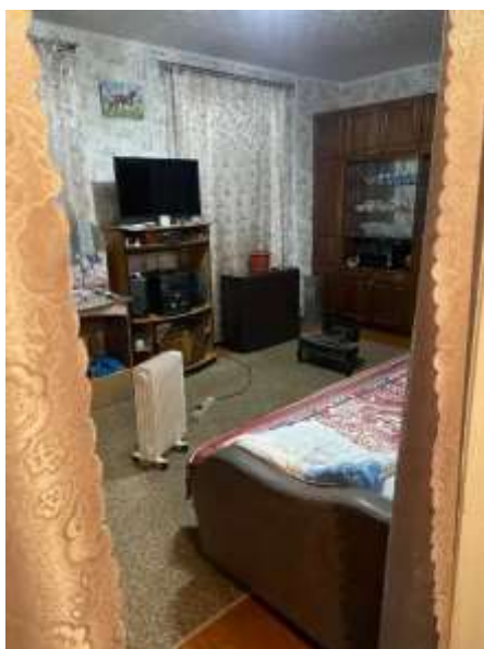
Фото №3. Комната