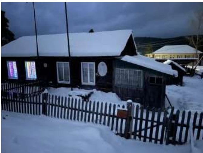
Фото №1. Общий вид дома