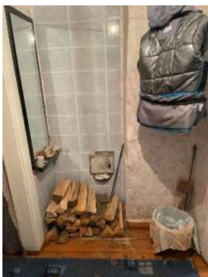
Фото №5. Общий вид квартиры