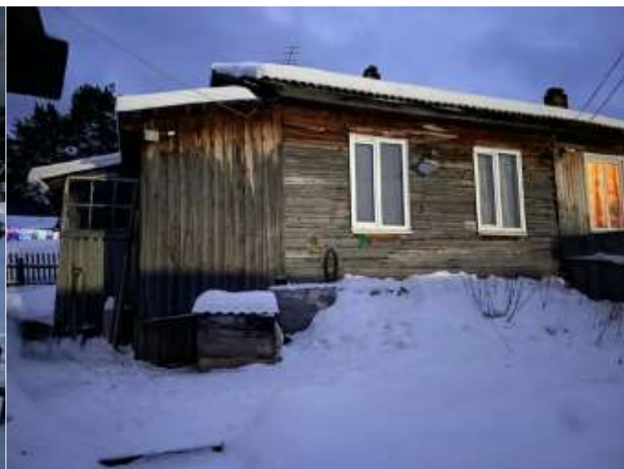
Фото №2. Общий вид дома