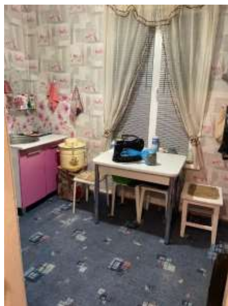
Фото №4. Кухня