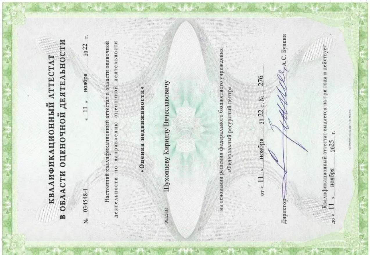
Квалификационный аттестат. Оценка недвижимости