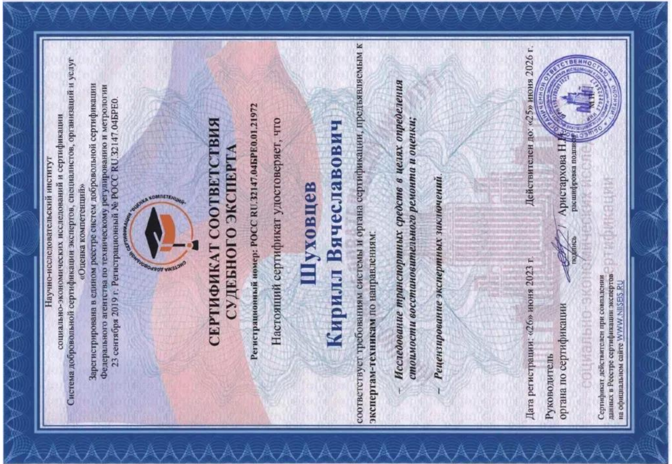
Сертификат соответствия судебного эксперта