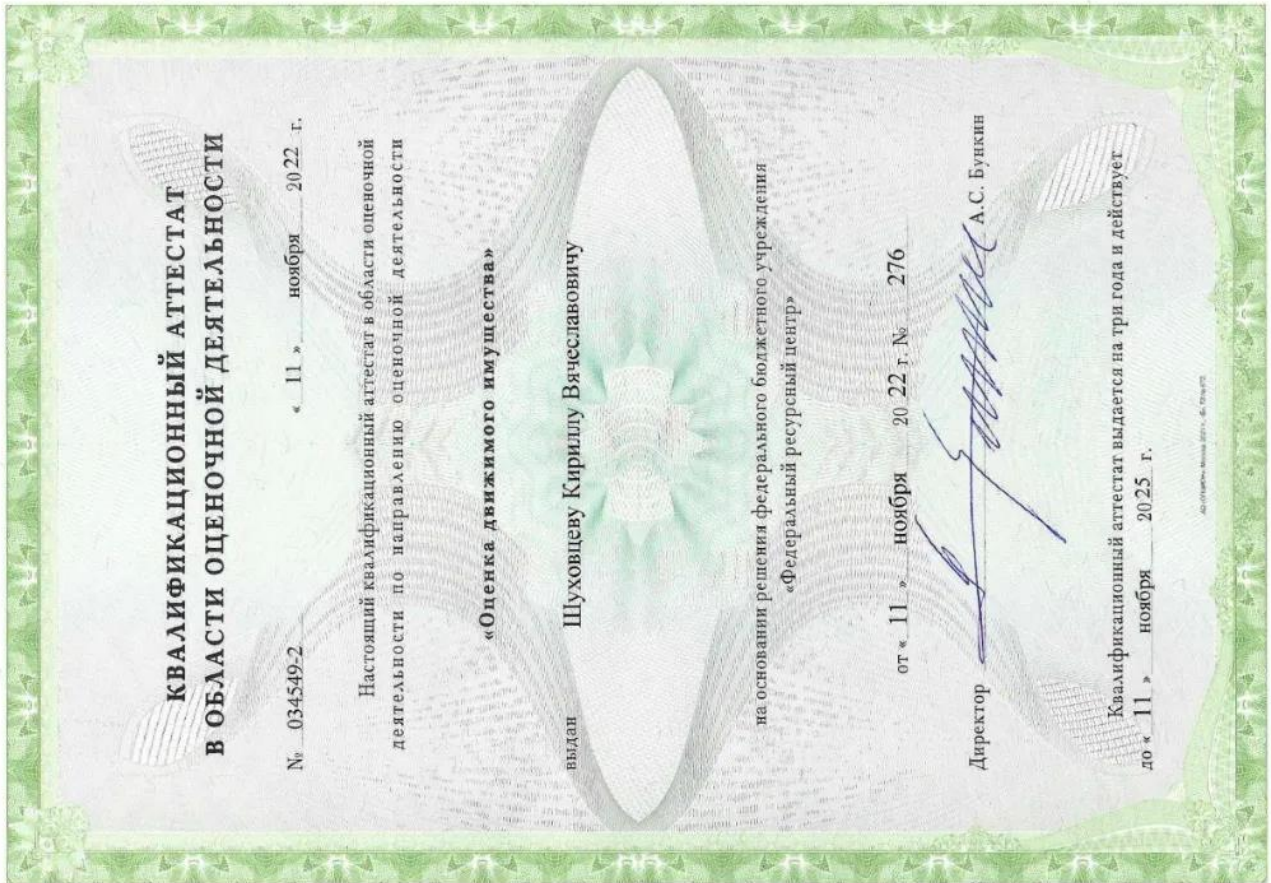
Квалификационный аттестат. Оценка движимого имущества