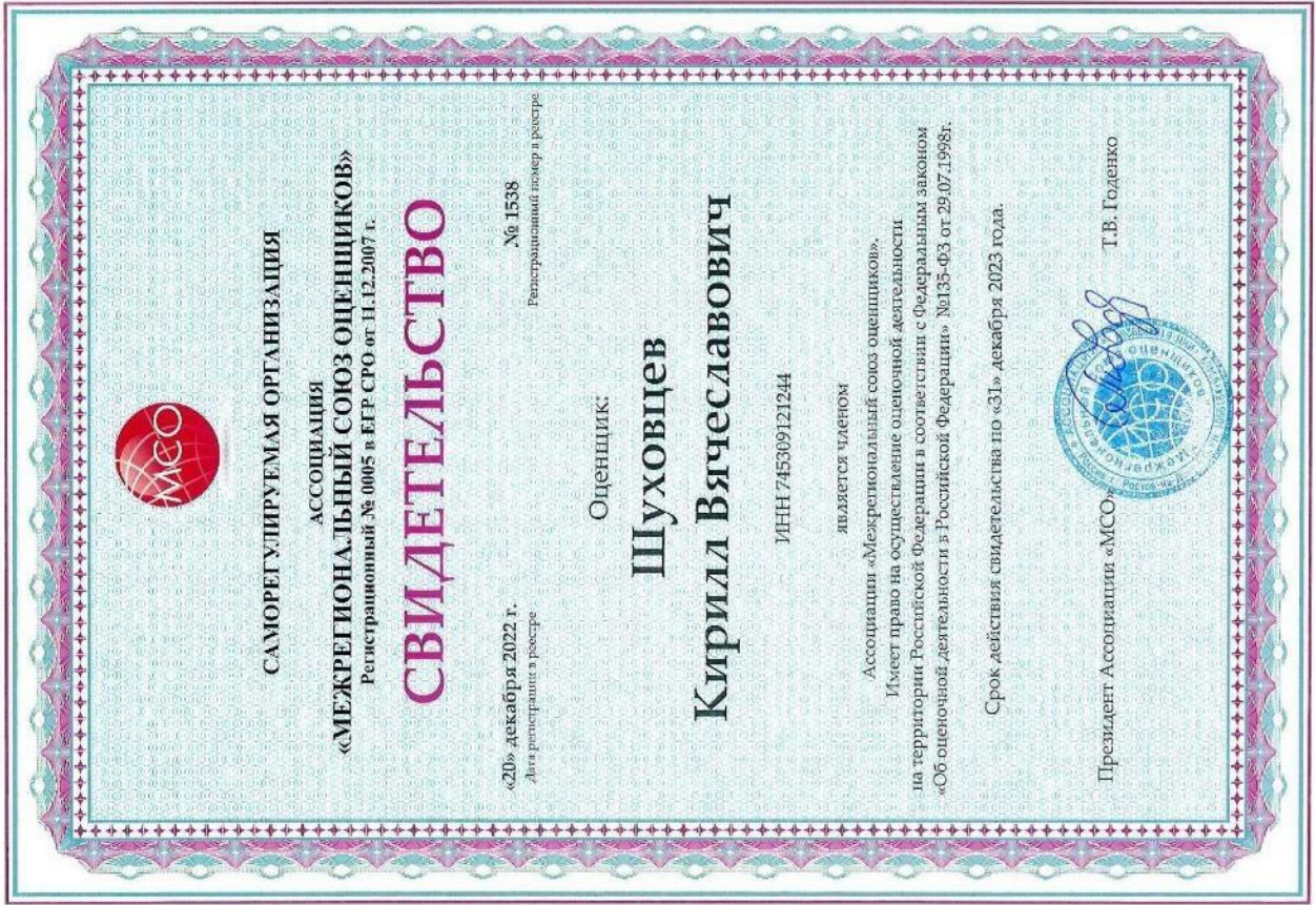
Свидетельство СРО оценщика