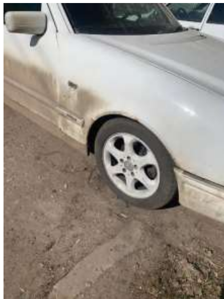
Фото №2. Общий вид