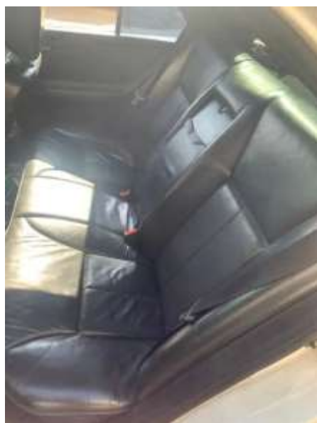
Фото №4. Общий вид