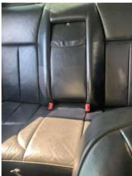
Фото №5. Общий вид