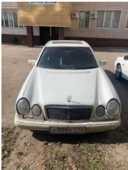
Фото №1. Общий вид