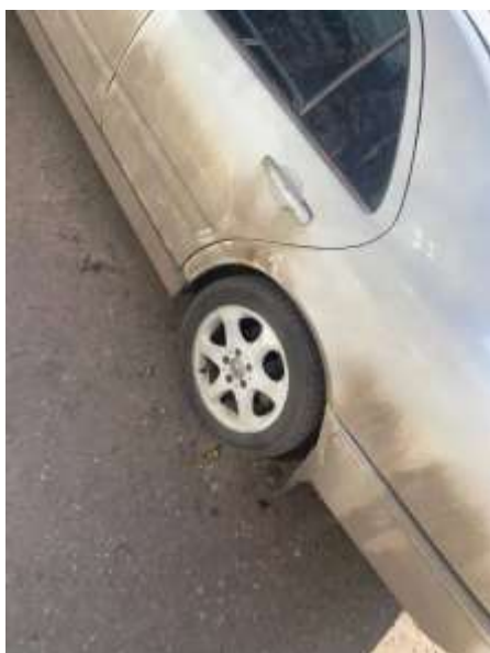
Фото №3. Общий вид