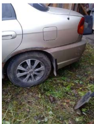
Фото №6. Фото авто