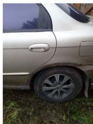
Фото №7. Фото авто