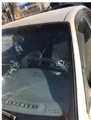
Фото №3. Фото авто