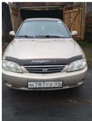
Фото №1. Фото авто