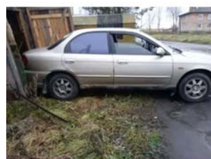
Фото №9. Фото авто