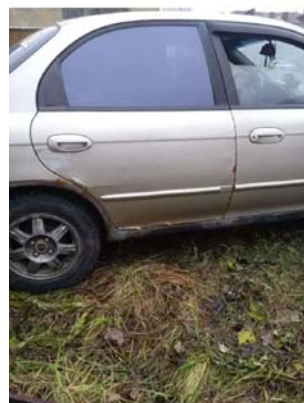
Фото №5. Фото авто