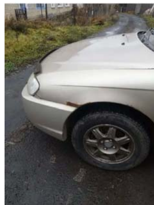
Фото №2. Фото авто