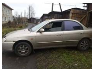
Фото №8. Фото авто