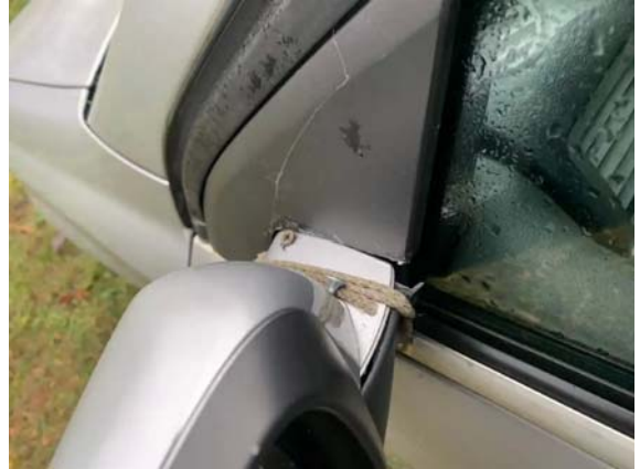
Фото №2. 3B83064A-D11C-7B34-3D5A-DD08124C4A68