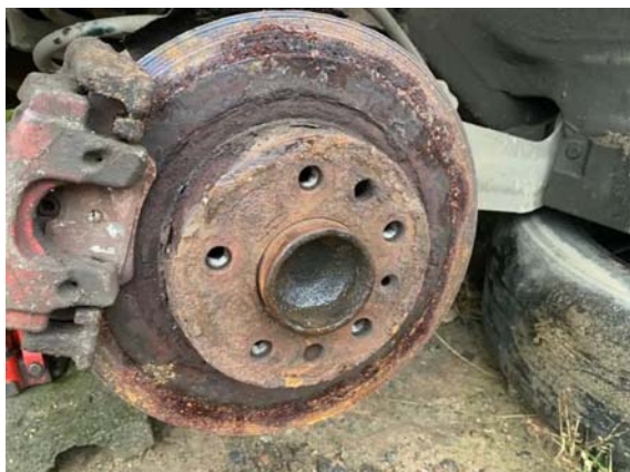
Фото №7. C674A966-B19E-05D0-9757-5E2541250393