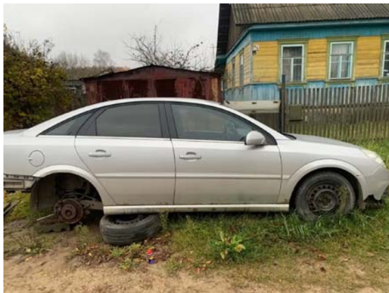
Фото №5. B8EAF353-3690-EB9B-4520-003FFB4368DA