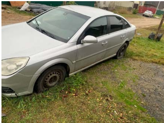
Фото №3. 93CF84AD-60F9-94F9-E34F-BE770B2CCF9C