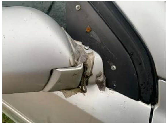
Фото №4. AA1A3585-A196-EB08-B5C4-DA1F824F72A6