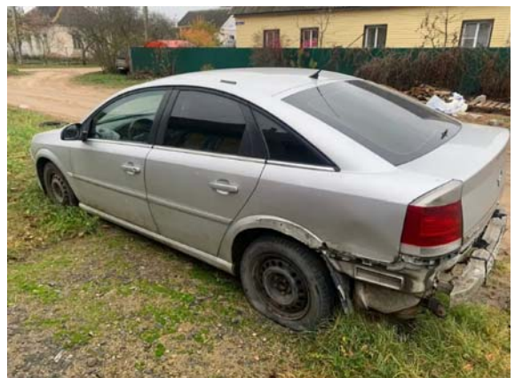
Фото №8. E956A3FE-8001-EC18-A44D-9F750D33E0A7