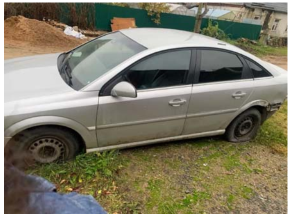
Фото №6. BF54F6E6-53C9-1322-0B5D-EA0C7E1DD85C