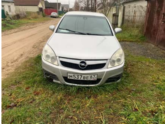
Фото №1. 00239F3C-60E1-0FCC-3B24-E8E52BDB71D6