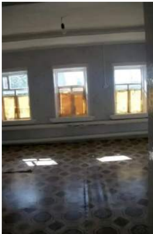
Фото №2. Общий вид