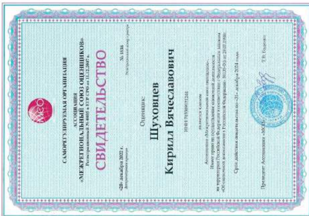
Свидетельство СРО оценщика