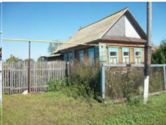
Фото №5. Общий вид