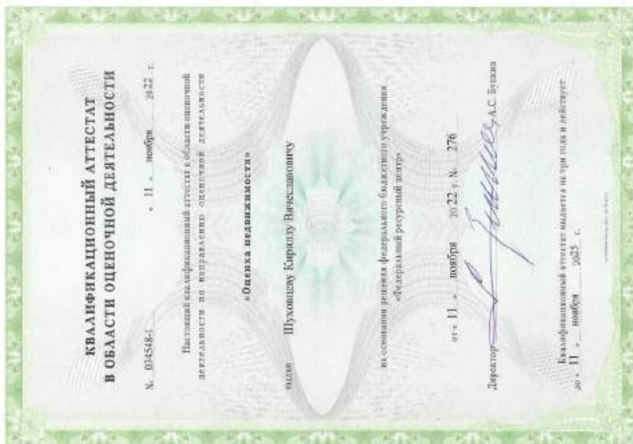
Квалификационный аттестат. Оценка недвижимости