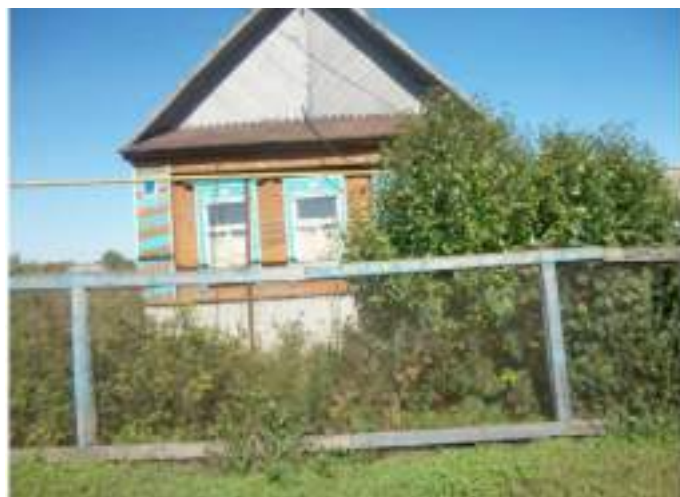
Фото №7. Общий вид