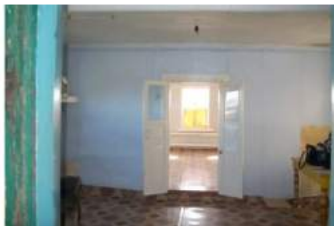
Фото №4. Общий вид