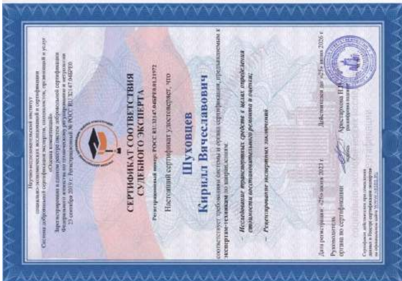
Сертификат соответствия судебного эксперта