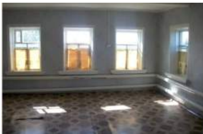
Фото №3. Общий вид