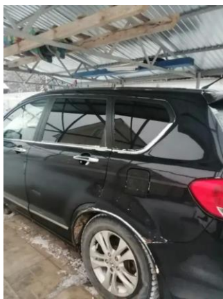
Фото №9. Общий вид