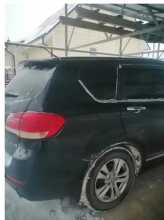
Фото №10. Общий вид