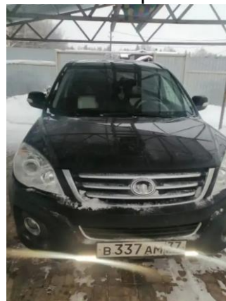
Фото №3. Общий вид