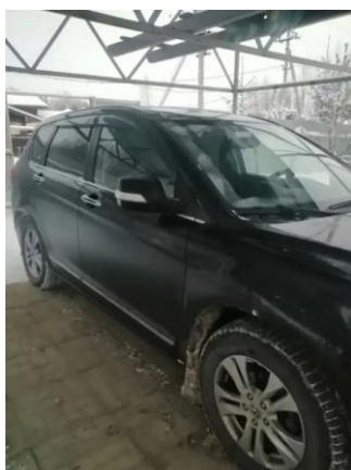
Фото №5. Общий вид