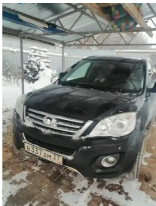
Фото №2. Общий вид