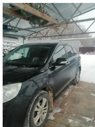
Фото №8. Общий вид