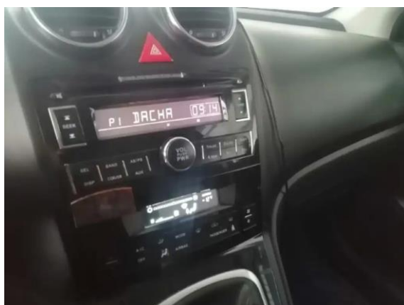
Фото №7. Общий вид