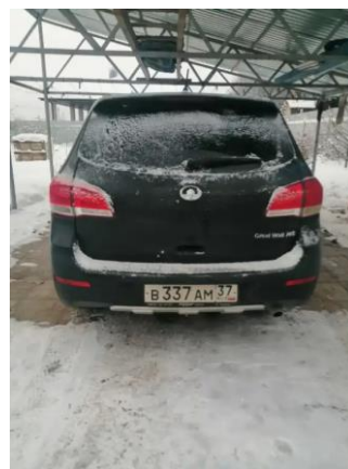
Фото №4. Общий вид