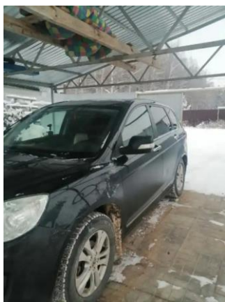
Фото №1. Общий вид