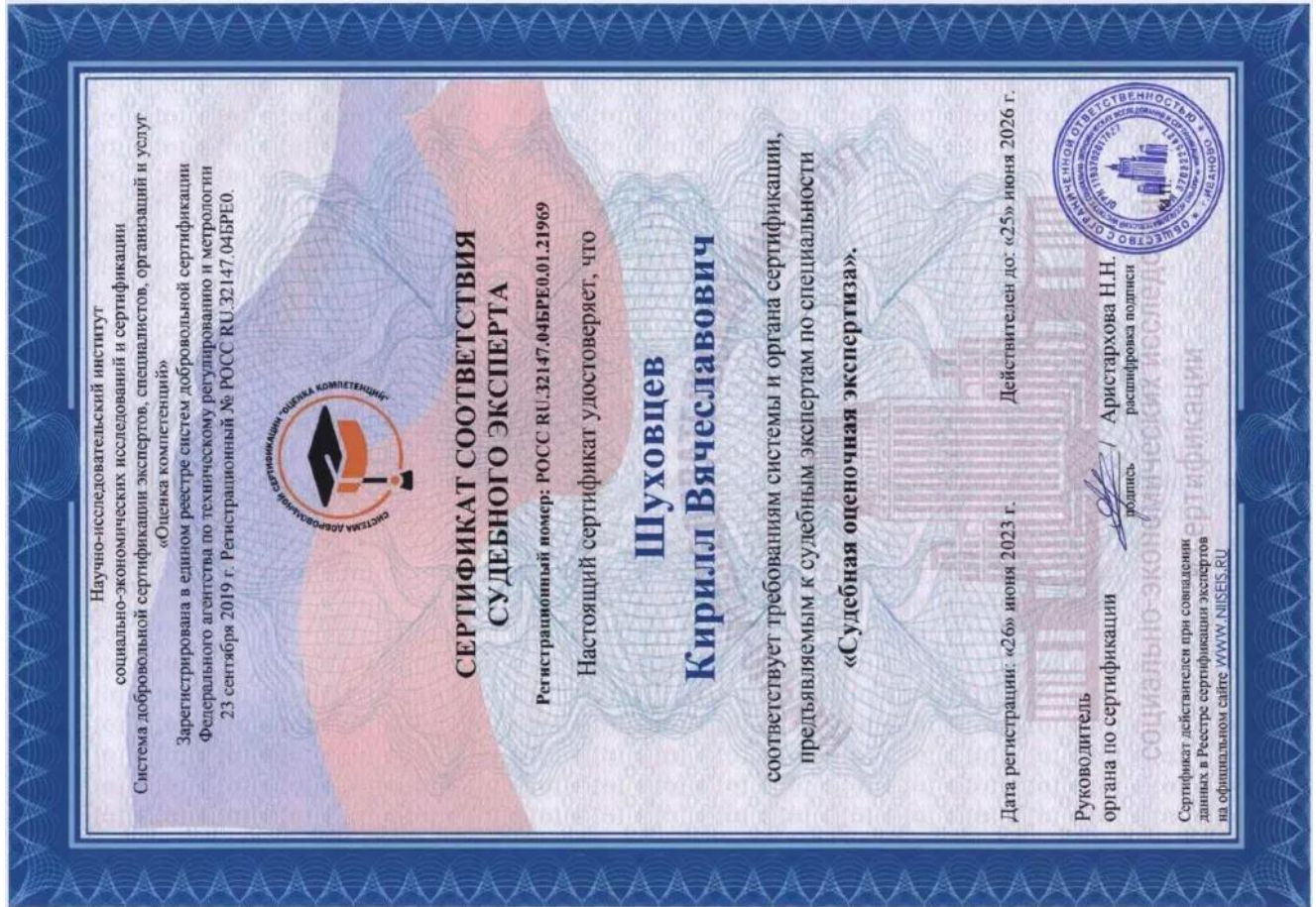
Сертификат соответствия судебного эксперта