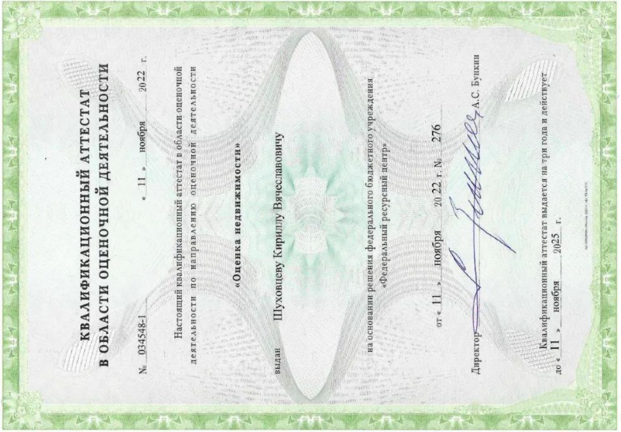
Квалификационный аттестат. Оценка недвижимости