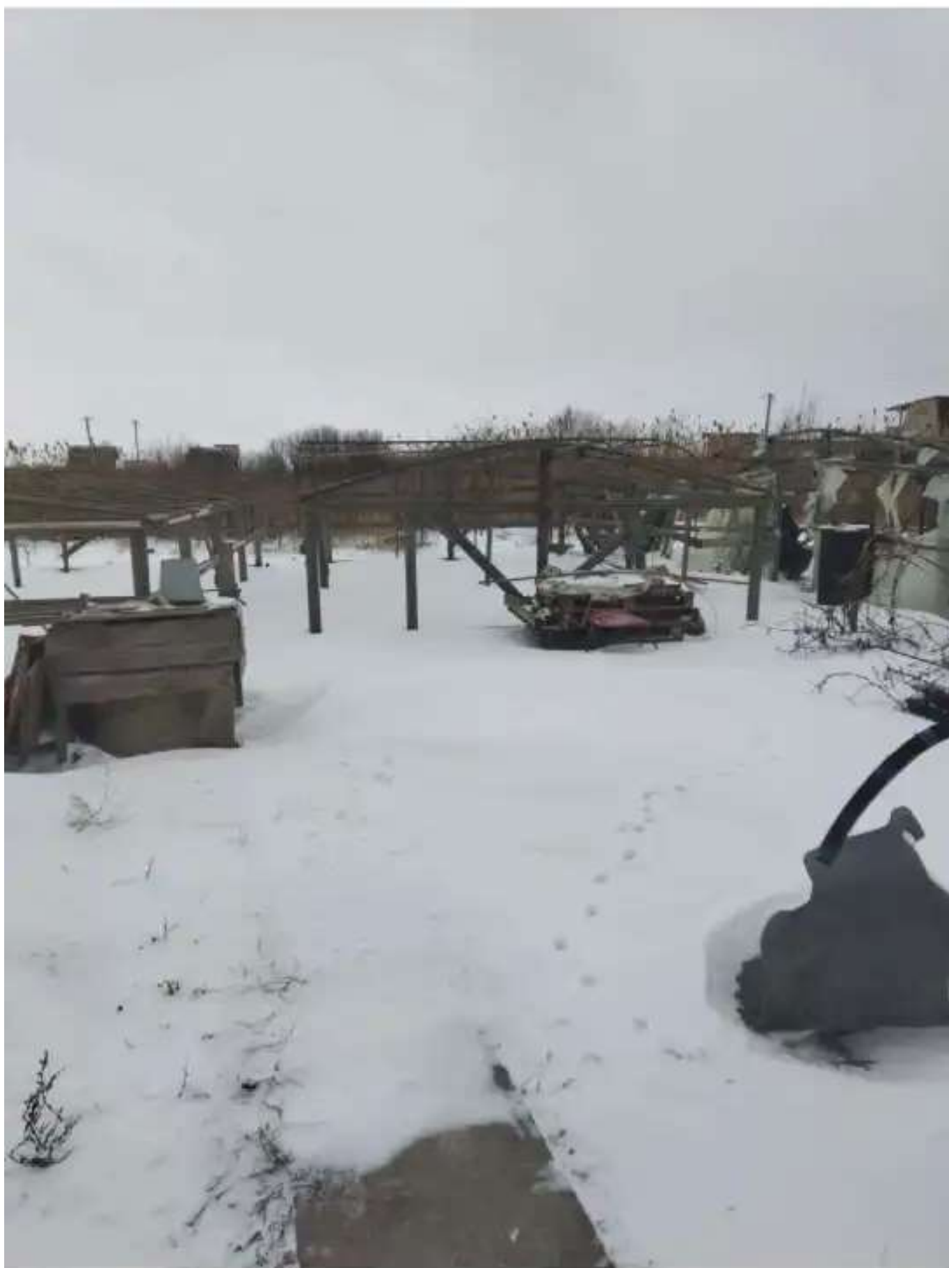
Фото №1. Общий вид участка