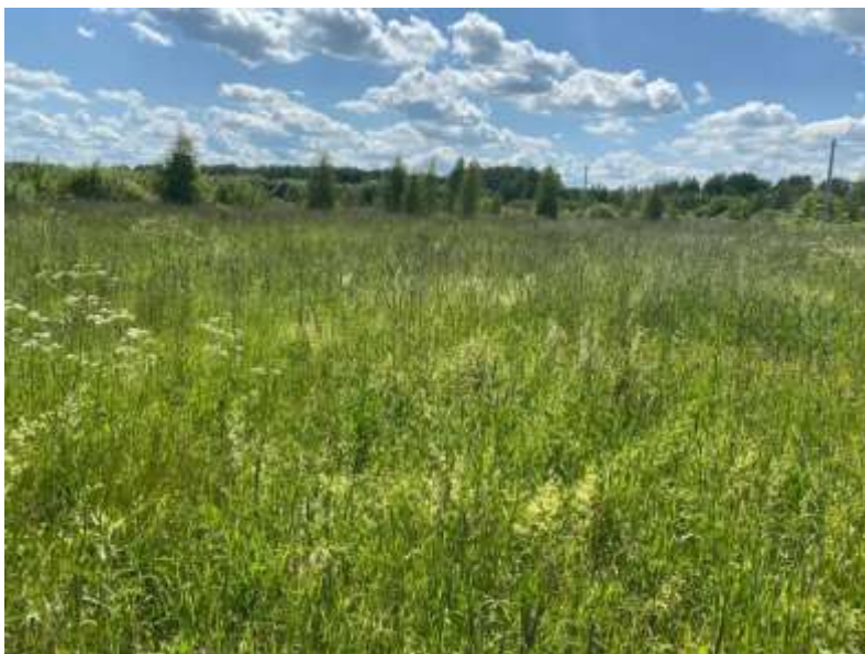
Фото №3. Общий вид участка