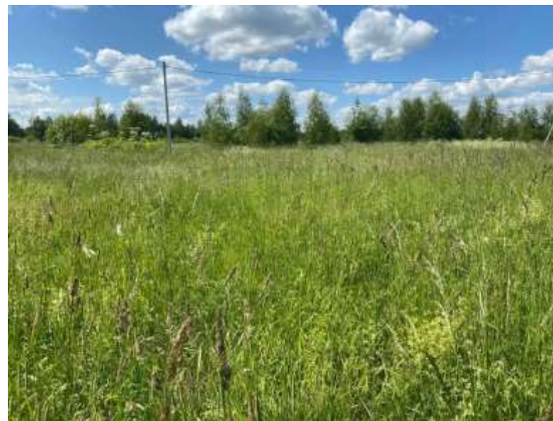
Фото №4. Общий вид участка