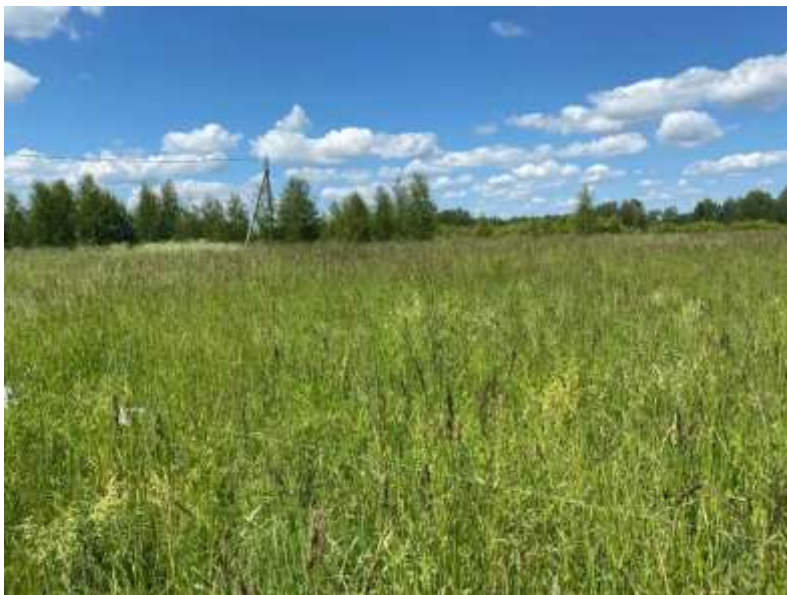
Фото №1. Общий вид участка