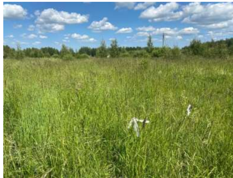
Фото №2. Общий вид участка