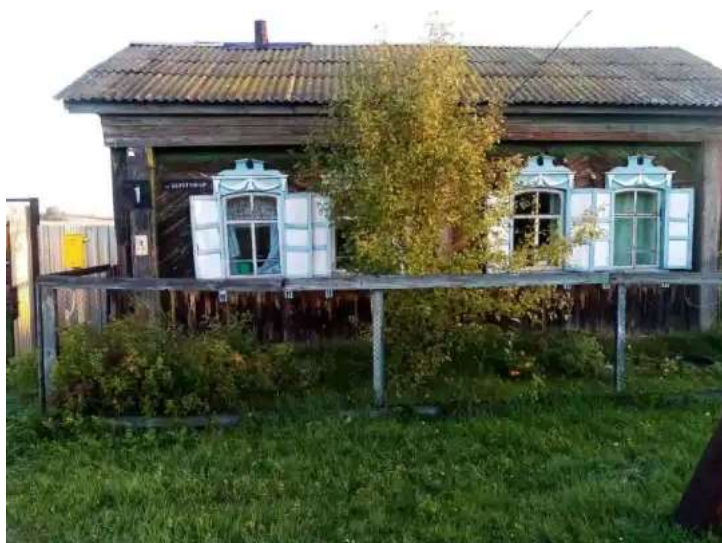
Фото №2. Общий вид дома на участке