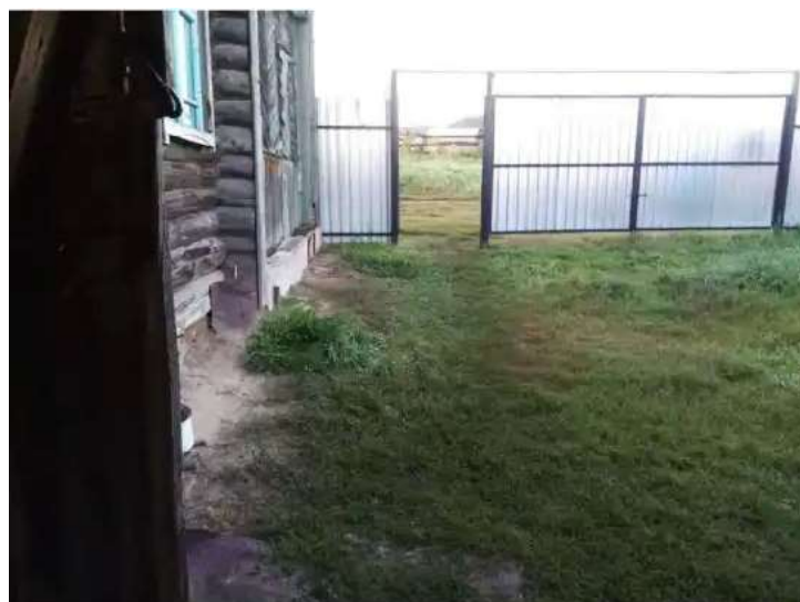
Фото №3. Общий вид дома на участке