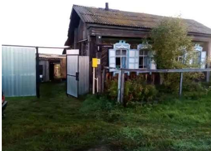
Фото №1. Общий вид дома на участке