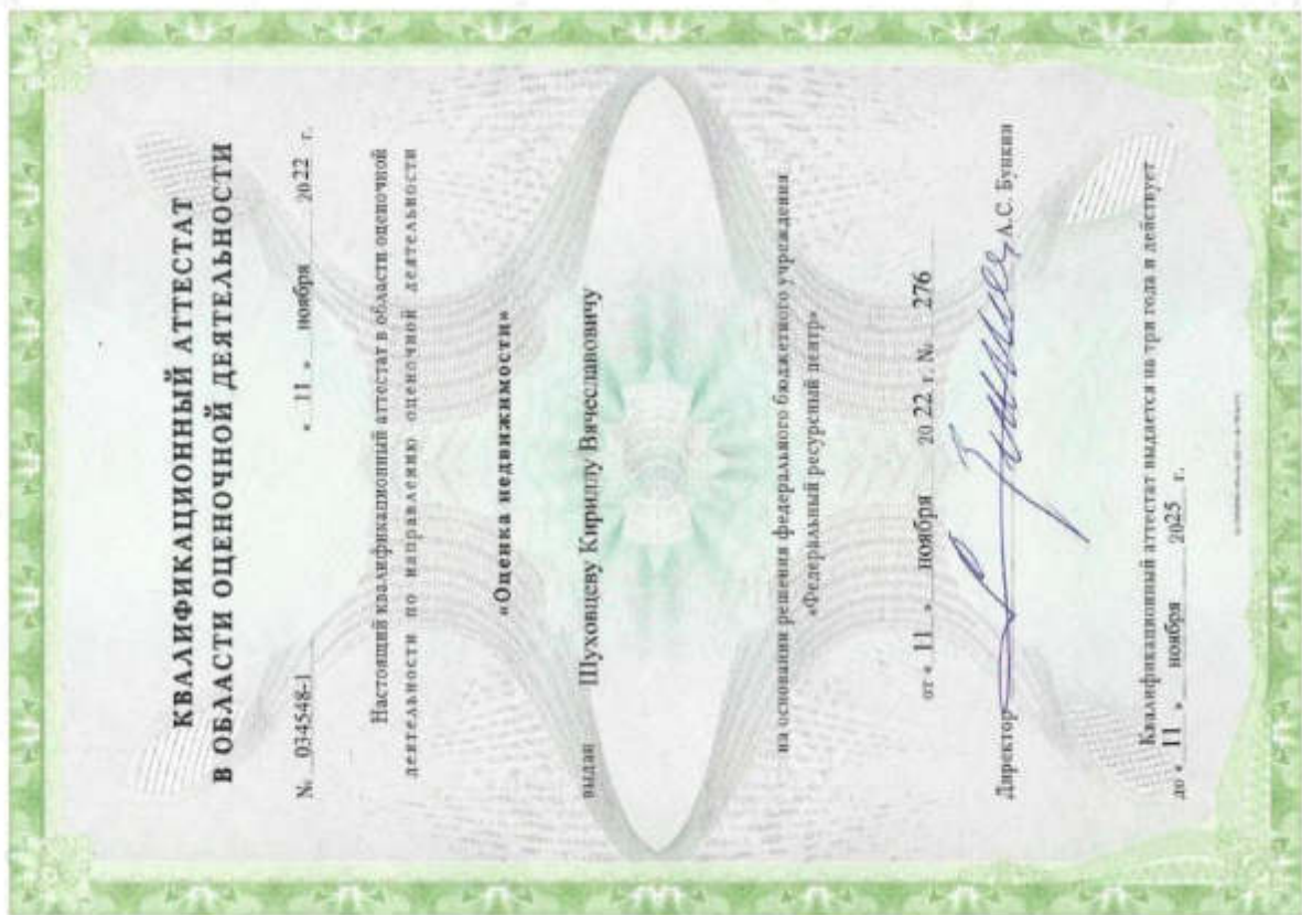
Квалификационный аттестат. Оценка недвижимости