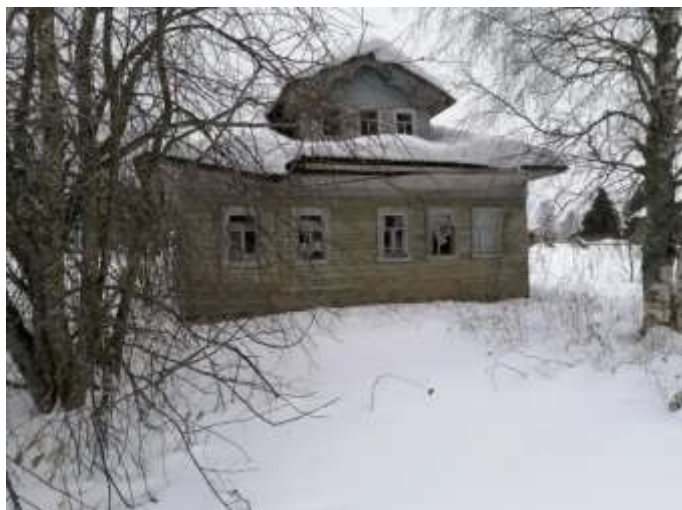
Фото №1. Общий вид дома