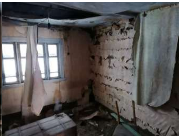
Фото №14. Общий вид дома