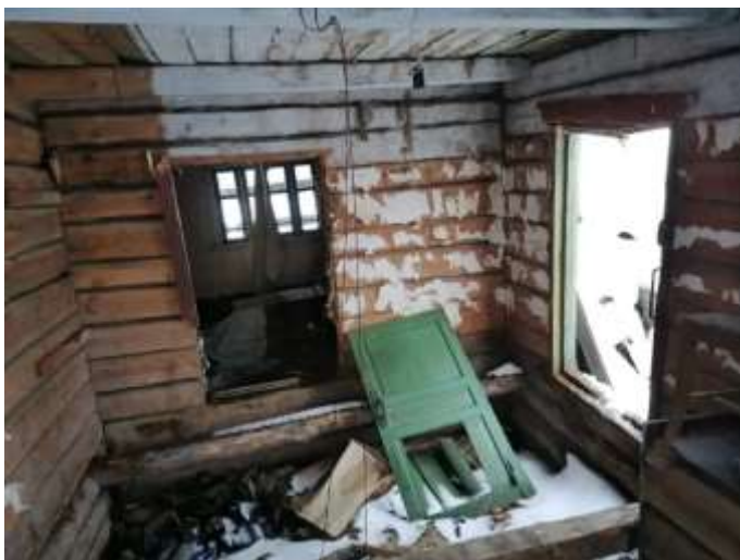
Фото №17. Общий вид дома