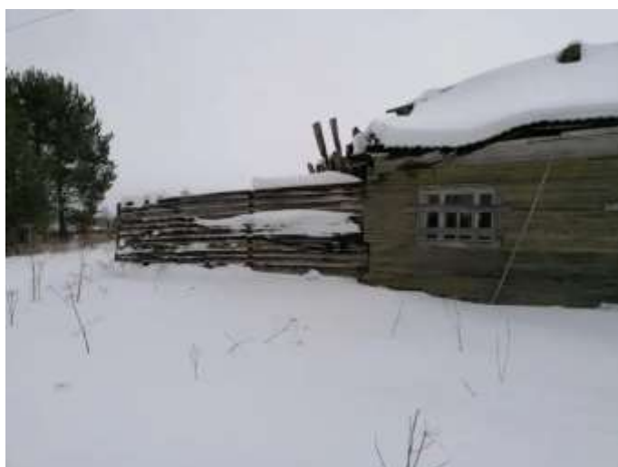
Фото №5. Общий вид дома