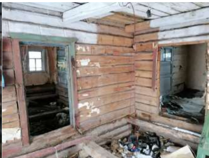
Фото №18. Общий вид дома