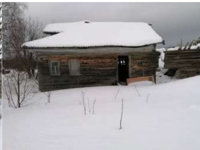
Фото №2. Общий вид дома