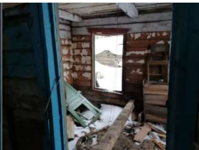
Фото №16. Общий вид дома