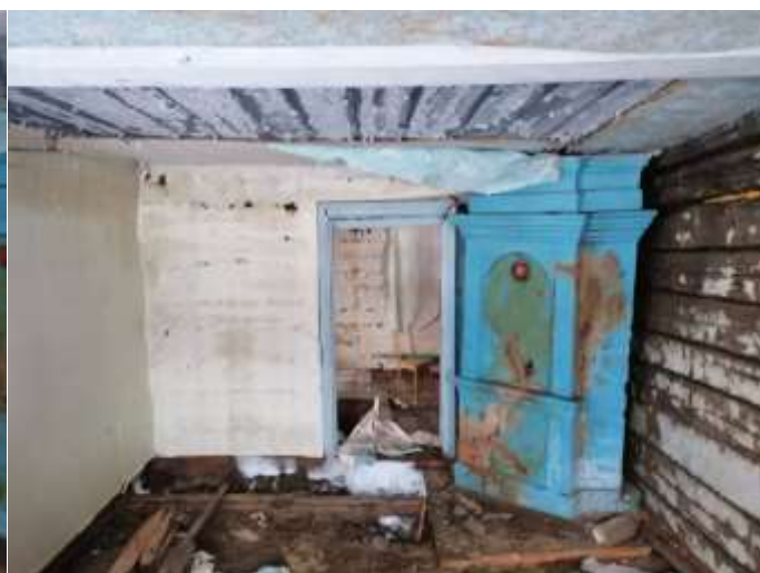
Фото №10. Общий вид дома