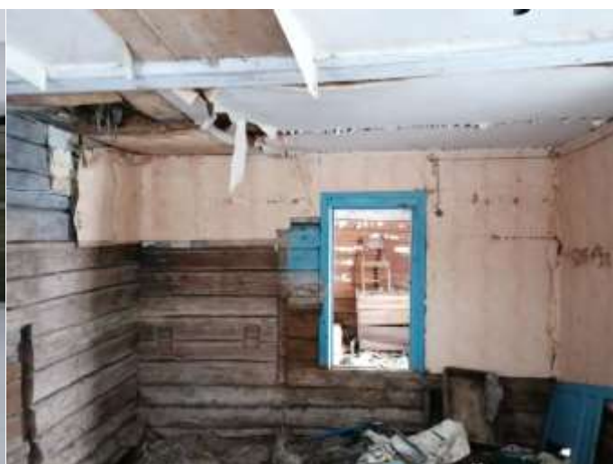
Фото №6. Общий вид дома