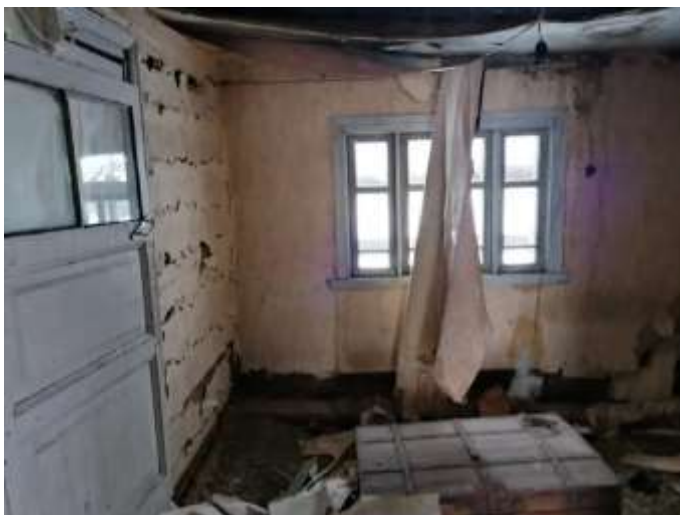
Фото №13. Общий вид дома