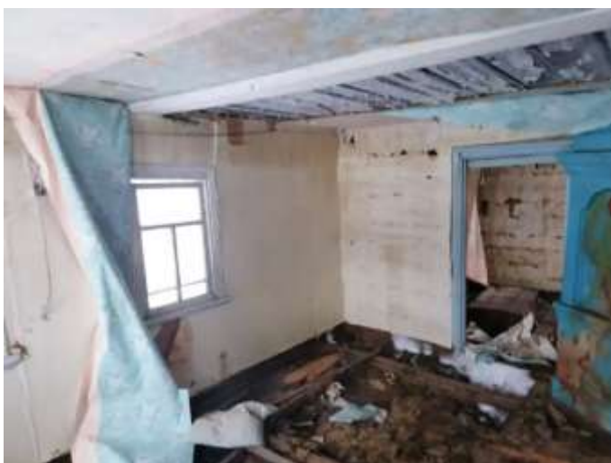
Фото №9. Общий вид дома