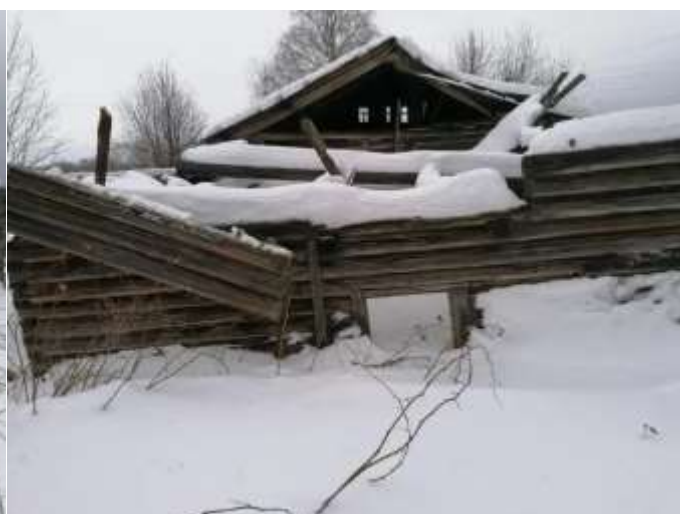
Фото №4. Общий вид дома