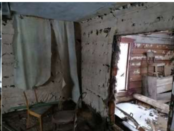
Фото №12. Общий вид дома