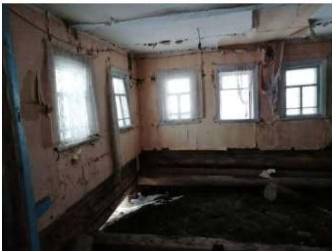
Фото №7. Общий вид дома