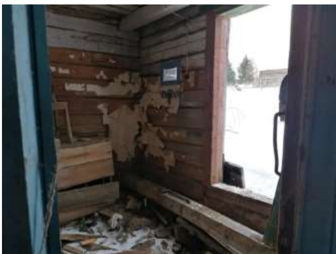
Фото №15. Общий вид дома