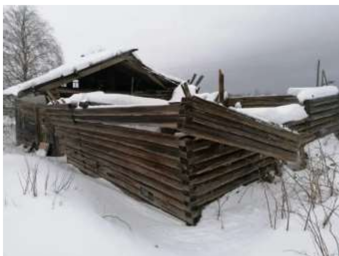
Фото №3. Общий вид дома