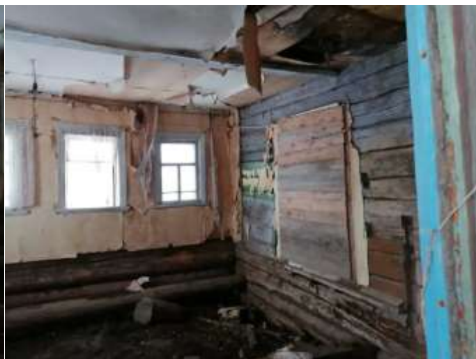
Фото №8. Общий вид дома