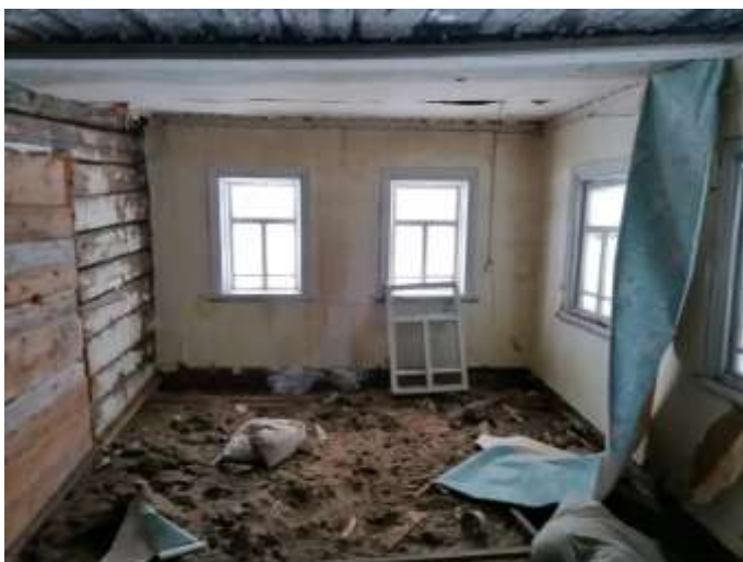
Фото №11. Общий вид дома