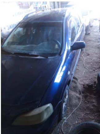
Общий вид ТС