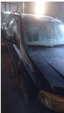
Общий вид ТС