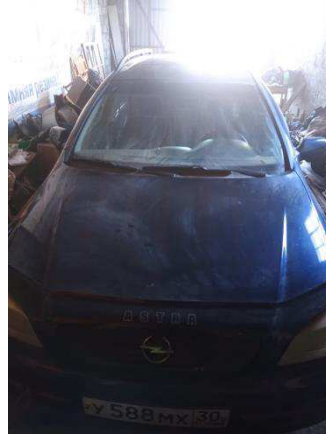
Общий вид ТС