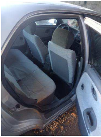
Общий вид салона ТС