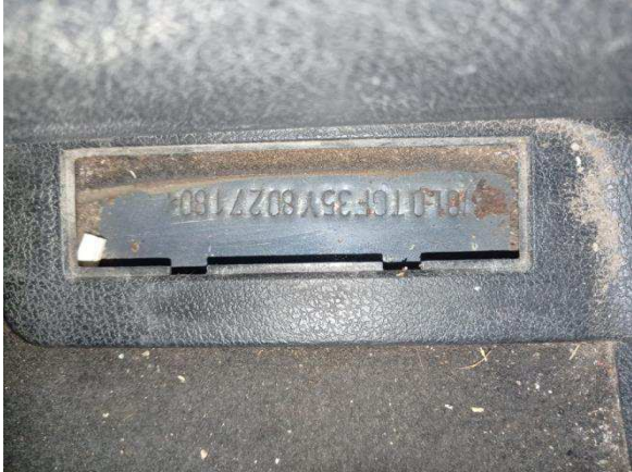
Номер кузова ТС