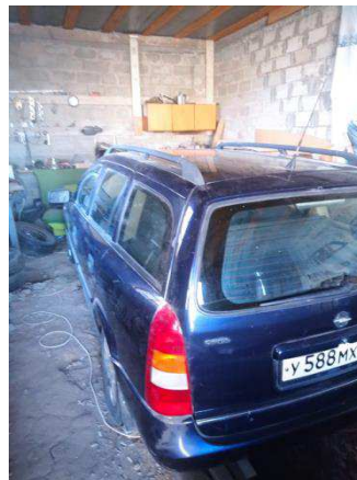
Общий вид ТС