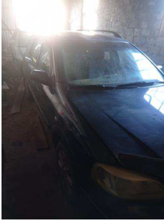
Общий вид ТС