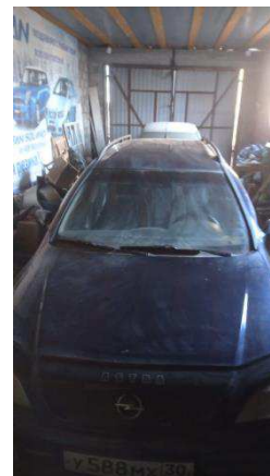
Общий вид ТС