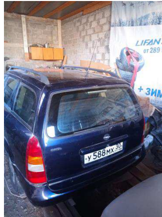
Общий вид ТС