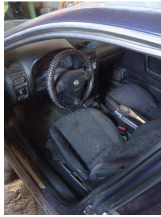
Общий вид салона ТС