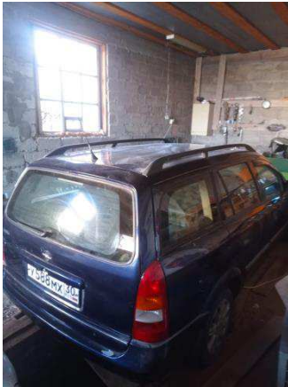
Общий вид ТС