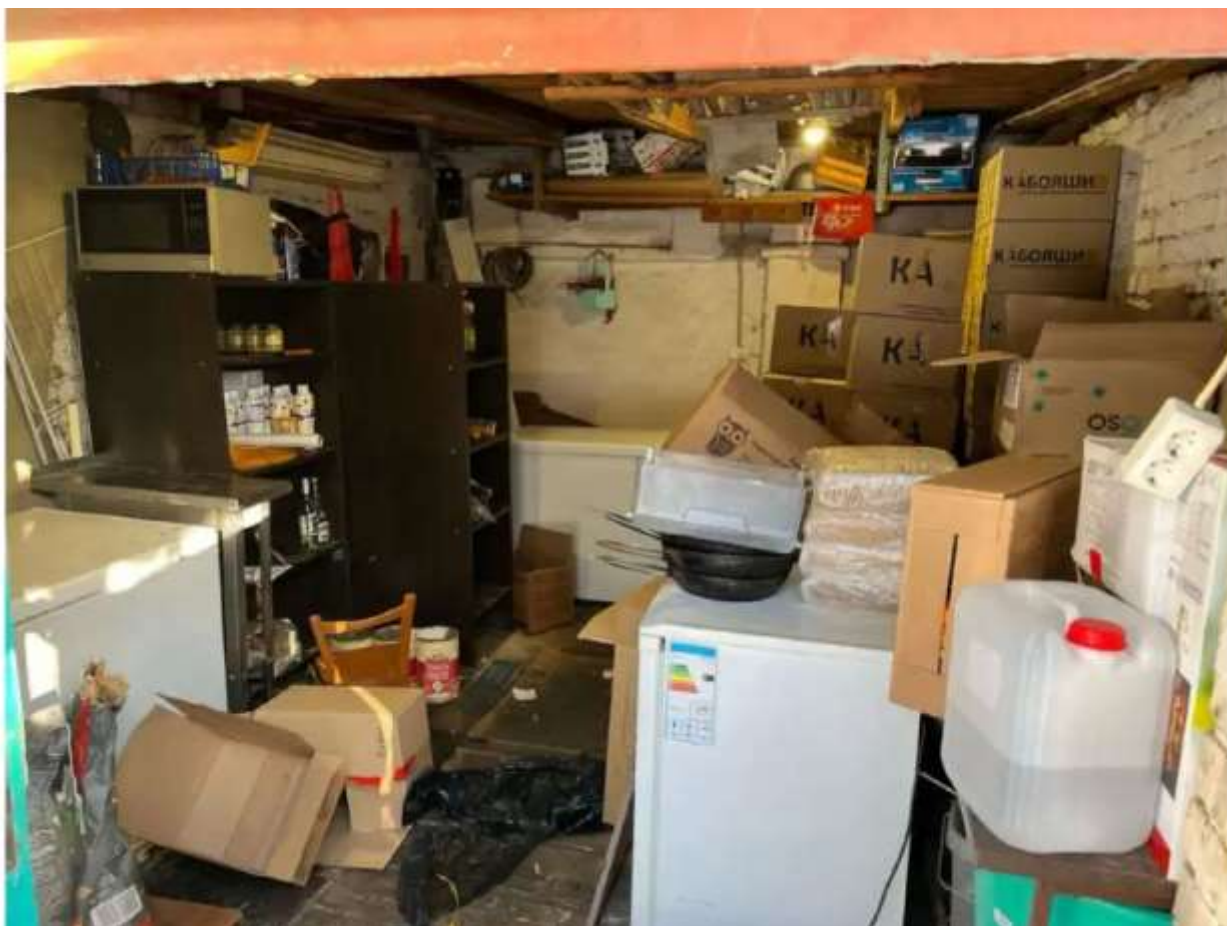
Фото №2. Общй вид гаража