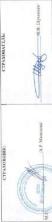
Полис страхования ответственности оценщика

Настоящий чистый экземпляр Полиса выдан: Договор N 211906-035-000025 от 22.11.2021 г. обязательного страхования ответственности оценщика.