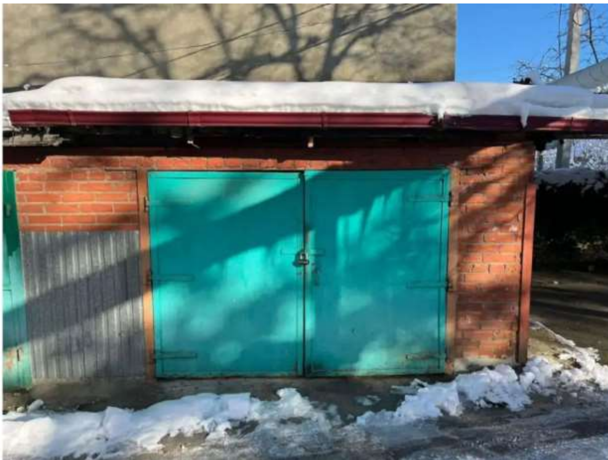
Фото №1. Общй вид гаража