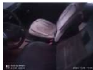
Фото №6. Общий вид