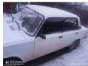
Фото №4. Общий вид