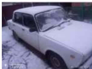
Фото №3. Общий вид