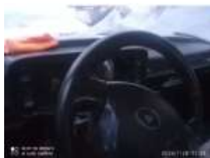
Фото №5. Общий вид