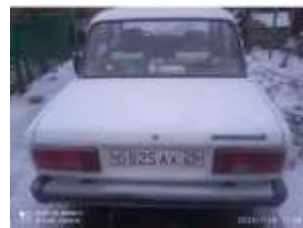
Фото №2. Общий вид