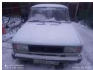
Фото №1. Общий вид