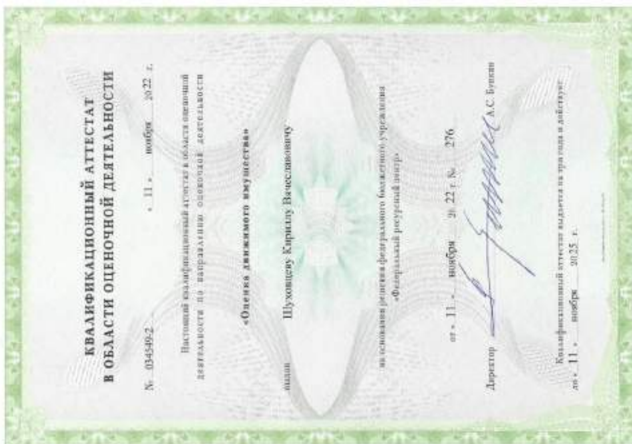
Квалификационный аттестат. Оценка движимого имущества