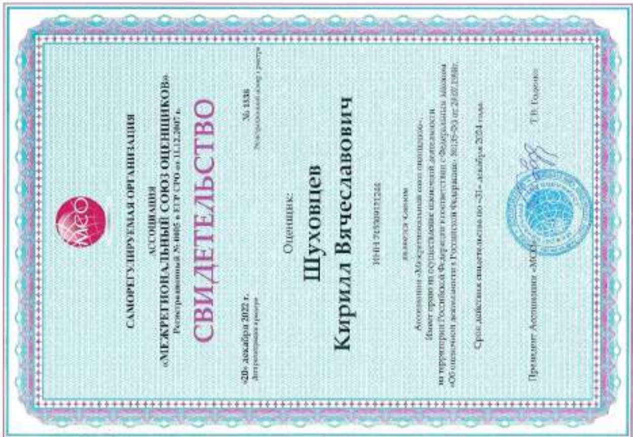
Свидетельство СРО оценщика