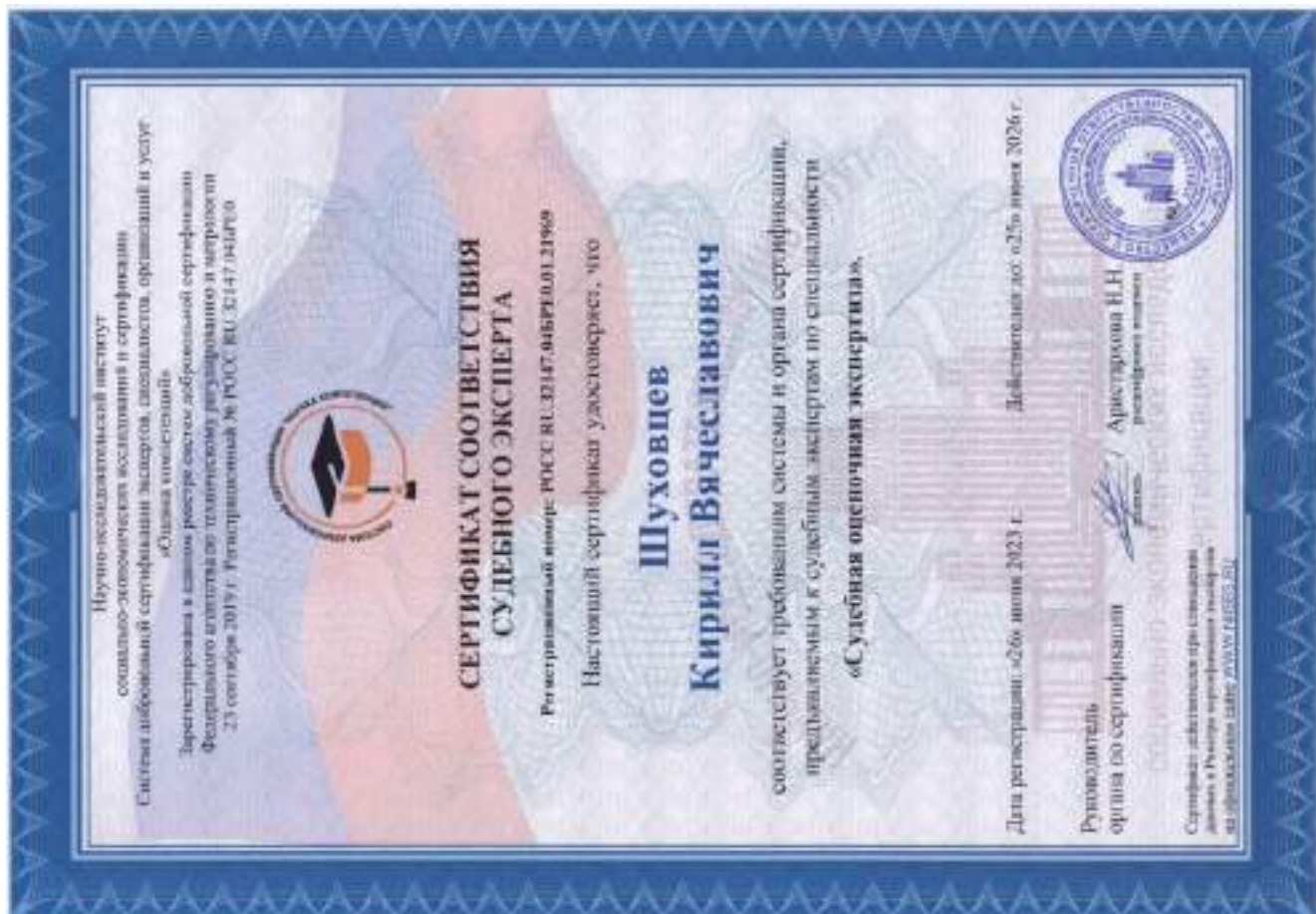
Сертификат соответствия судебного эксперта