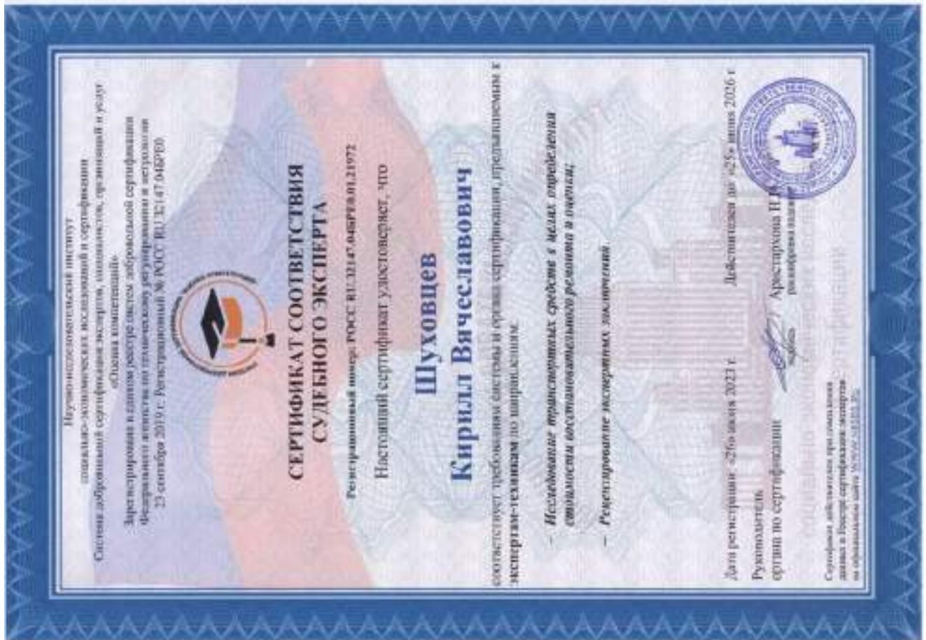
Сертификат соответствия судебного эксперта