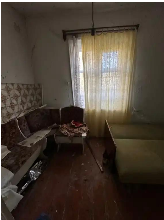
Фото №9. Общий вид дома