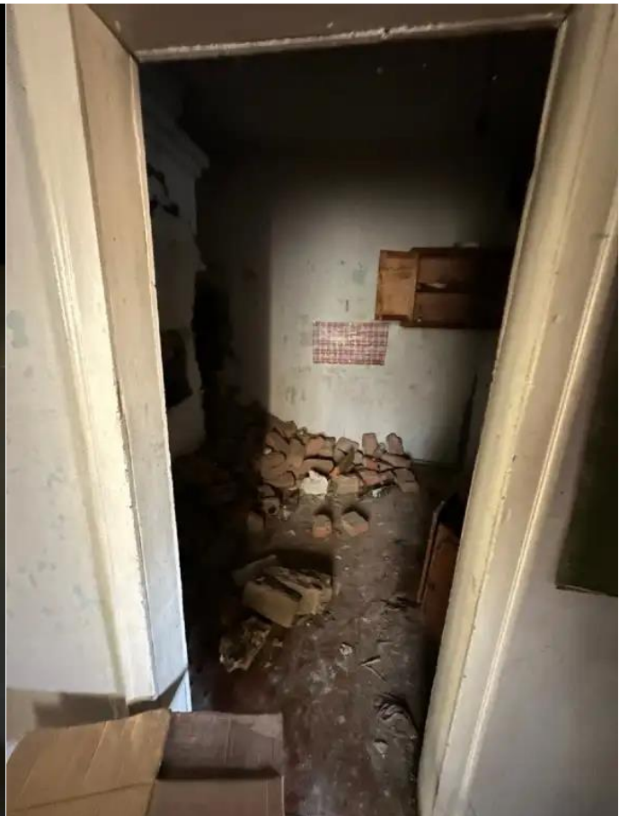
Фото №8. Общий вид дома