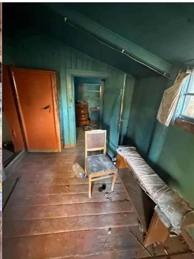
Фото №4. Общий вид дома