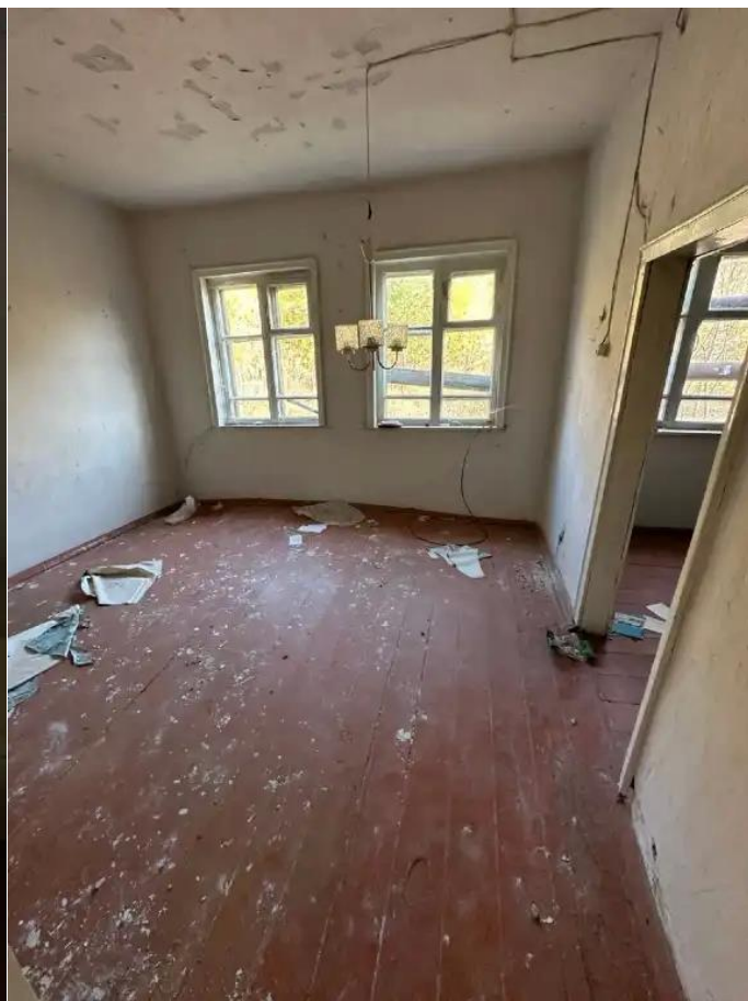
Фото №10. Общий вид дома