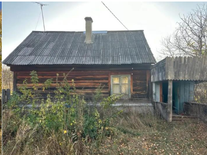
Фото №2. Общий вид дома на участке