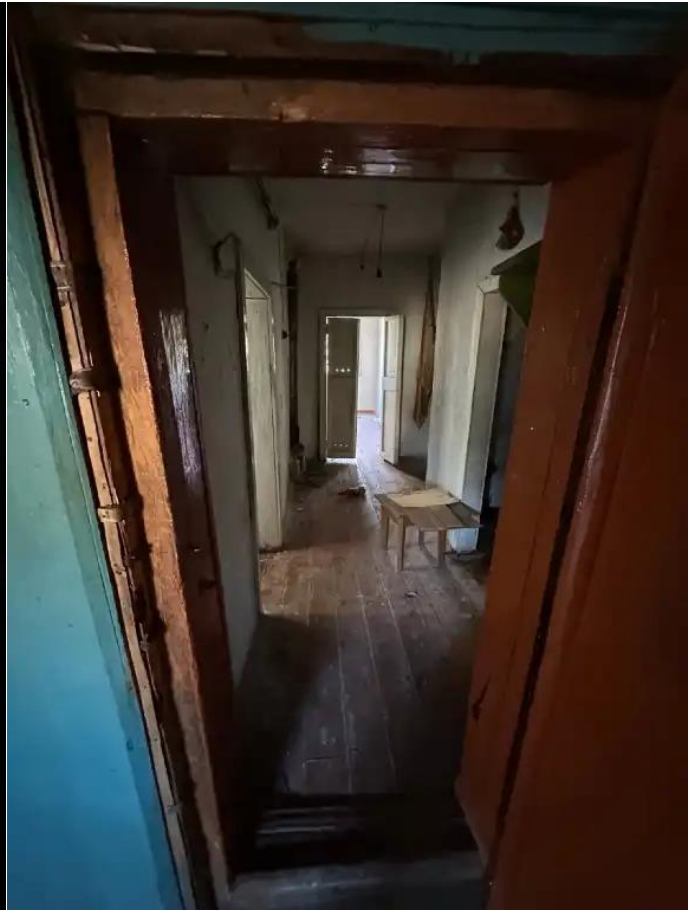
Фото №6. Общий вид дома