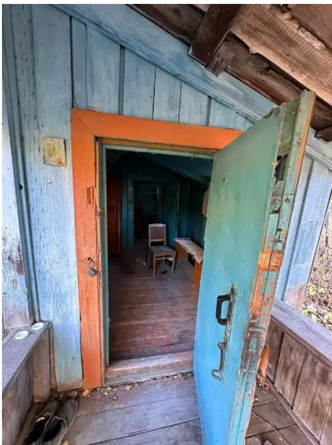
Фото №3. Общий вид дома