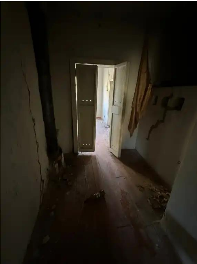
Фото №7. Общий вид дома