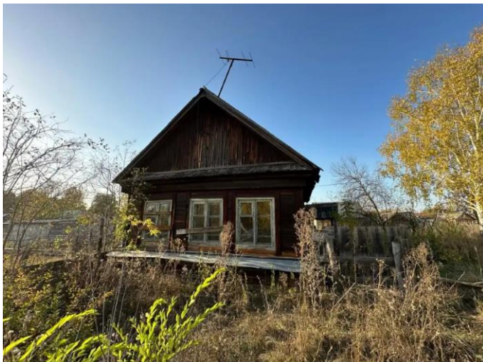
Фото №1. Общий вид дома на участке