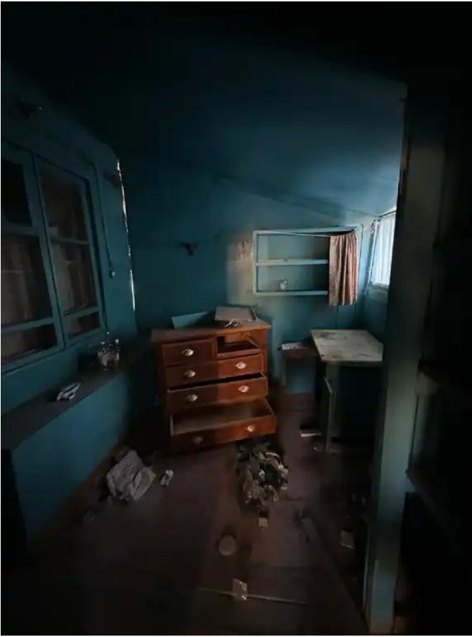
Фото №5. Общий вид дома